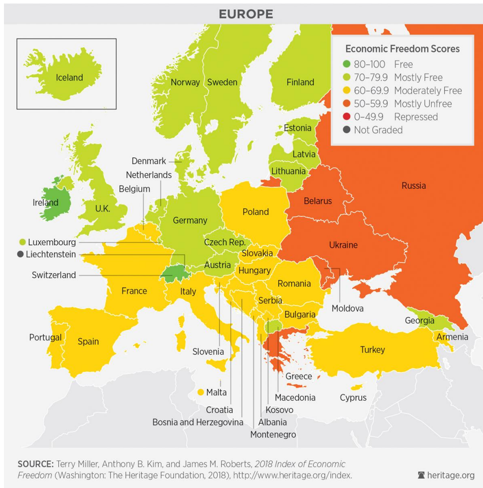
Рисунок 3 - Індекс економічної свободи: Європа [3]

Всі ці показники відображають макроекономічну стабільність країни. Проте, значна частина із зазначених показників в сучасних реаліях формується за принципом знизу в гору, тобто з мікро- до макрорівня. Така ситуація обумовлена їх економічною сутністю та посилюється процесом децентралізації, що проходить в Україні.