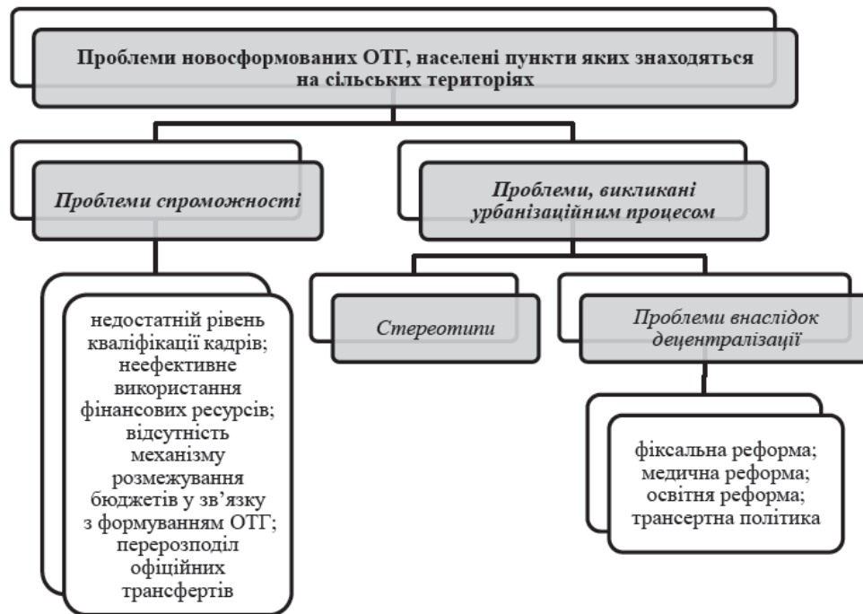
Рисунок 4 - Проблеми новосформованих ОТГ [4]

Отже, як бачимо зі схеми, наведеної вище, проблематика ОТГ лежить в трьох основних сферах: