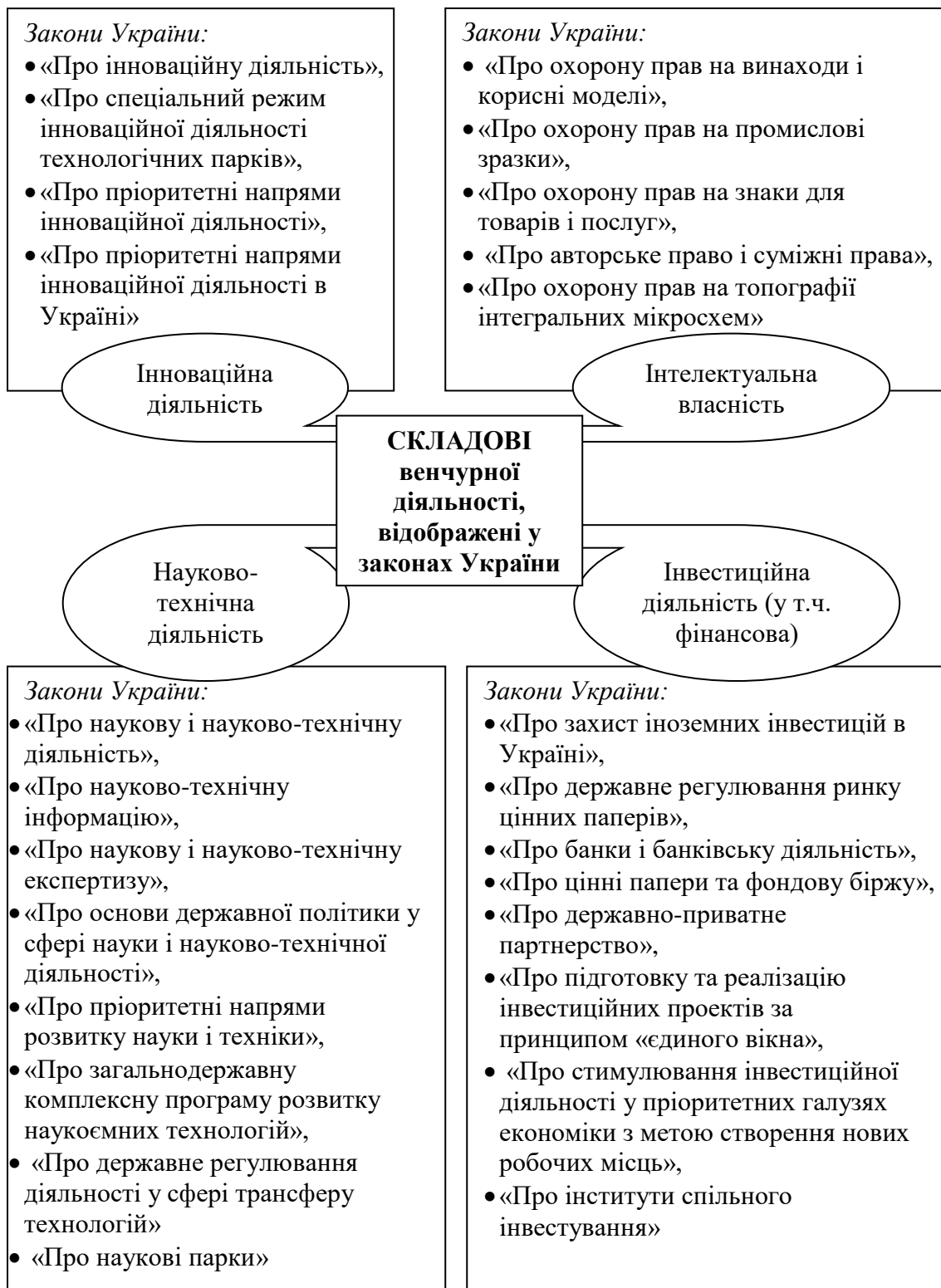
Рис. 1 Складові венчурної діяльності, відображені у законах України

Крім організаційного регламентування венчурної діяльності, важливою є система економічних відносин, які врегульовують різні її аспекти (фінансові, інвестиційні тощо). На мікроекономічному рівні венчурна діяльність