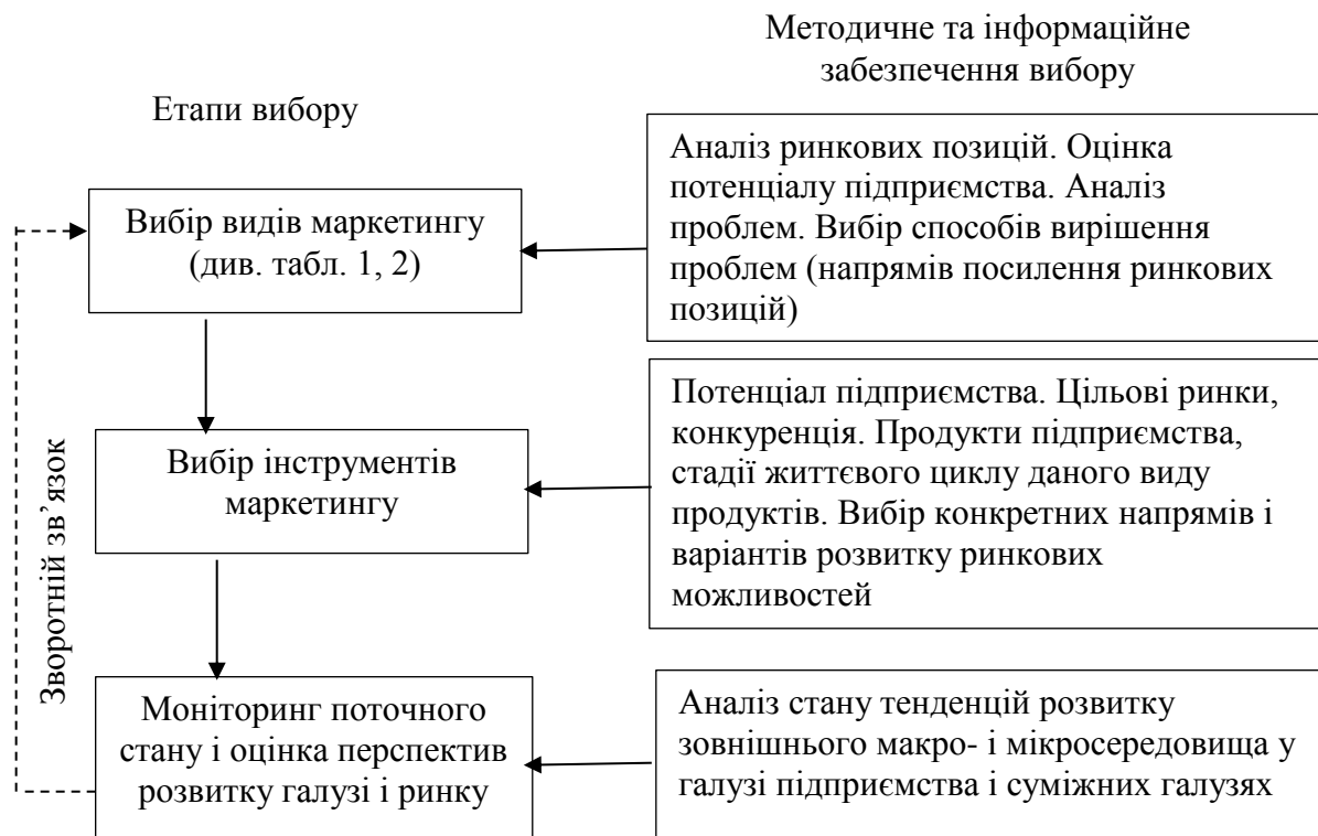
Рисунок 2 – Схема вибору видів і інструментів маркетингу (авторська розробка)

На рис. 2 подана узагальнена схема поетапного вибору видів маркетингу та інструментів, які вони використовують.