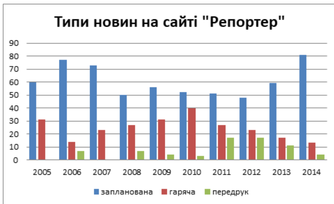
Діаграма 3. Типи новин на сайті «Репортер»

Подивимося на співвідношення інших типів новин на сайтах, а саме запланованих, гарячих, а також передруків ексклюзивної інформації з інших ЗМІ (див діаграми 3, 4).