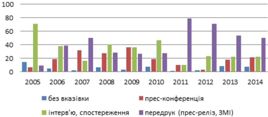
Діаграма 5. Способи збору інформації на сайті «Репортер»