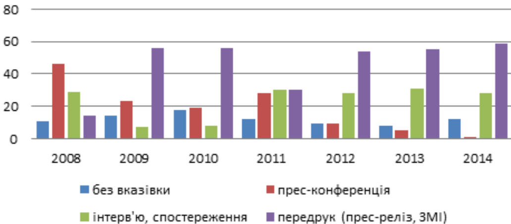
Діаграма 6. Способи збору інформації на сайті «Думская»

«Репортері». Адже журналістам легше передрукувати інформацію про певний захід із прес-релізу, ніж бути присутніми на ньому.