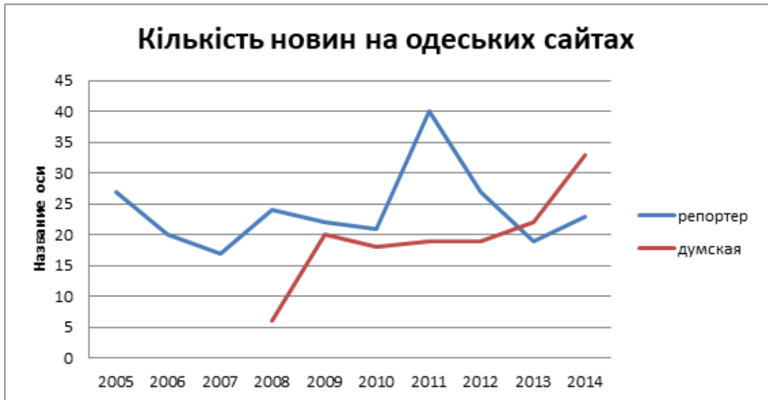
Діаграма 1. Кількість новин на одеських сайтах