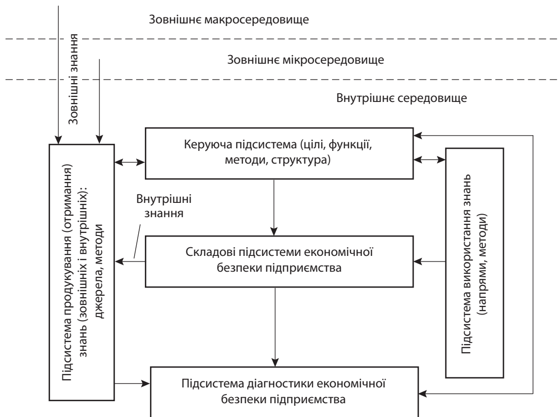
Рис. 2. Схема організаційно-економічного механізму управління знаннями в контексті забезпечення економічної безпеки підприємства

Отримання (продукування) нових знань відбувається у процесі моніторингу стану зовнішнього макро- та мікросередовища, а також наявного потенціалу підприємства. Невідповідність потенціалу підприємства зовнішнім умовам (які постійно змінюються) збільшує ризик і зменшує рівень економічної безпеки підприємства. У цьому випадку необхідно адекватно оцінювати рівень невідповідності та при досягненні певного критичного рівня проводити заходи щодо приведення потенціалу підприємства у відповідність до нових умов зовнішнього середовища.