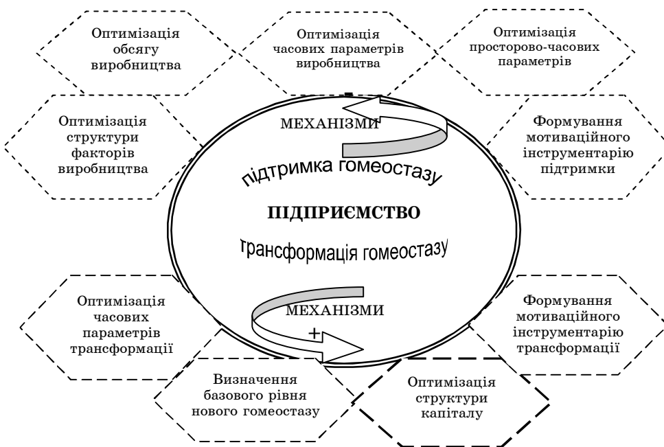
Рисунок 1 - Механізми управління стійкістю підприємства, згруповано за [7, 238-256]

Механізм управління стійкістю підприємства передбачає створення оптимальної структури капіталу (рис.1).