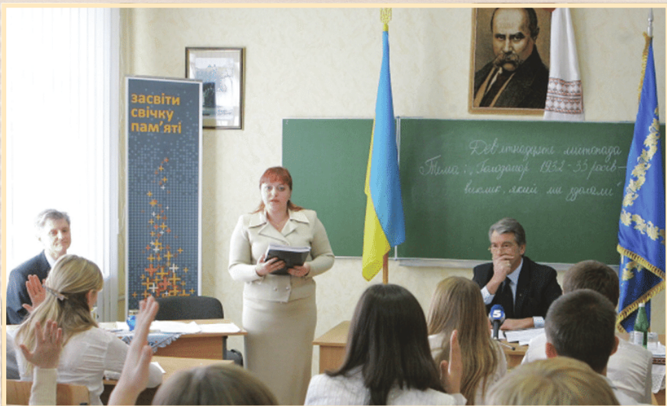
18 листопада 2008 р., Харків, Всеукраїнський урок пам'яті