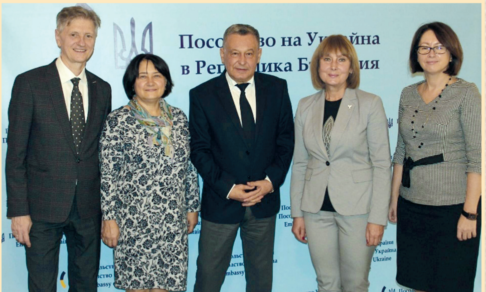
15 жовтня 2019 р., Софія, Посольство України в Республіці Болгарія, зустріч української делегації з Надзвичайним та Повноважним Послом України В. Москаленком