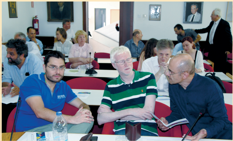
20 червня 2018 р., Салоніки, Університет Аристотеля, напередодні панельної дискусії про українсько-грецькі відносини