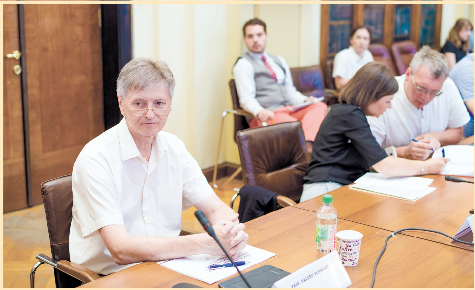
25 червня 2018 р., Бухарестський університет, круглий стіл, присвячений 100-річчю встановлення українсько-румунських дипломатичних відносин