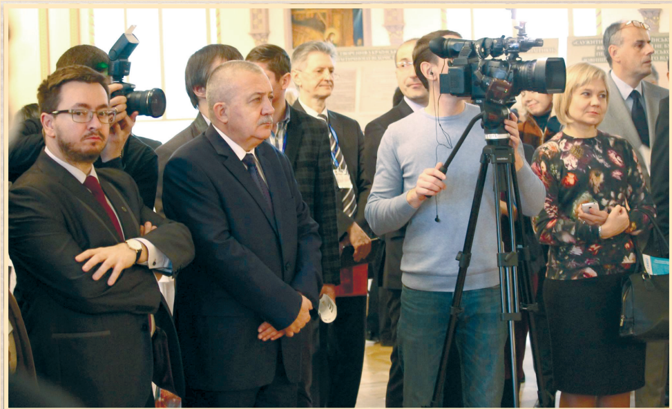
30 листопада 2017 р., Київ, Дипломатична академія України ім. Г.Й. Удовенка при МЗС України, відкриття виставки "Українська дипломатія: 1917–1924 рр. (зародження національних традицій)"