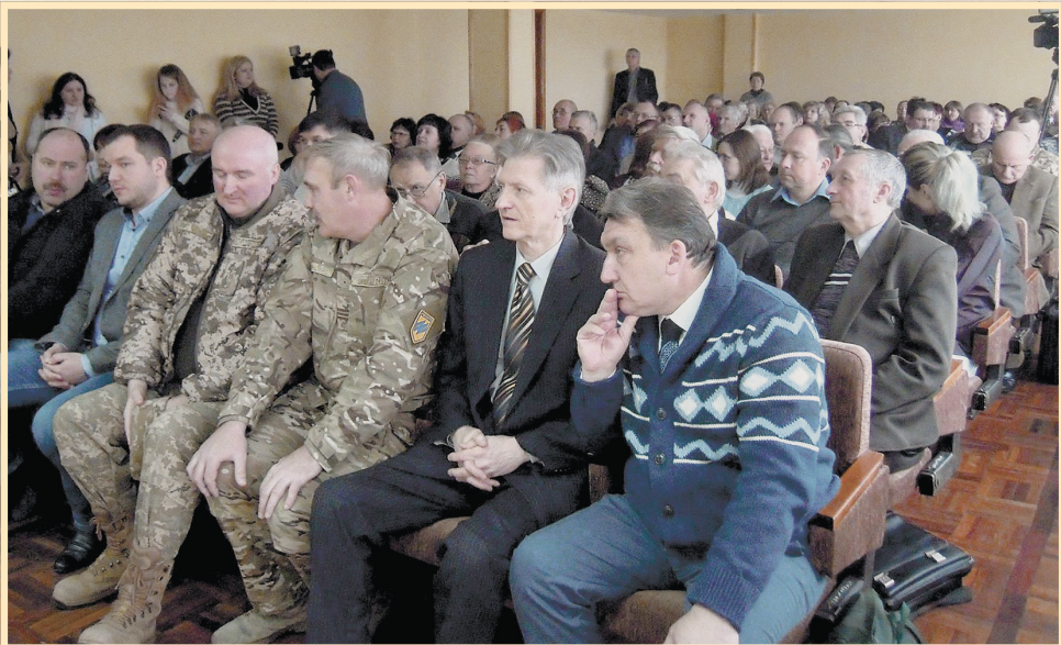
10 січня 2018 р., Сумська обласна наукова бібліотека, презентація серії книг про Українську революції 1917–1921 рр.