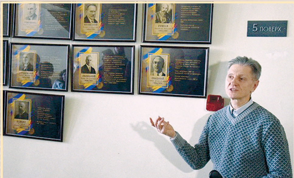
11 січня 2019 р., Сумська обласна державна адміністрація, виставка портретів діячів Української революції 1917–1921 рр. — уродженців Сумщини