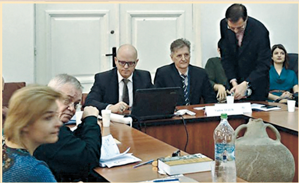
30 березня 2017 р., Бухарест, VII Міжнародна наукова конференція "Комунізм в Румунії"