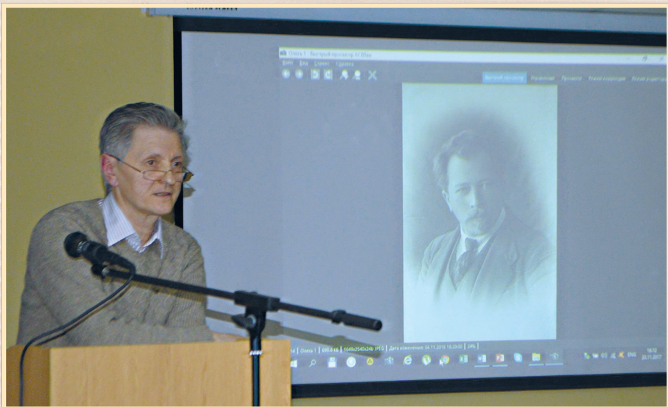
23 листопада 2017 р., Сумська обласна наукова бібліотека, відкриття виставки "Спротив геноциду" та "круглий стіл", присвячений темі Голодомору 1932–1933 рр. в Україні