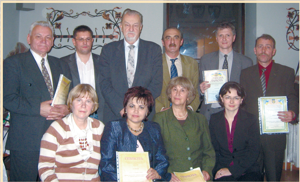
Квітень 2006 р., Львів, лауреати Премії Фонду Воляників-Швабінських при Фундації Українського вільного університету в Нью-Йорку, стоїть 3-й зліва іноземний член НАН України Леонід Рудницький