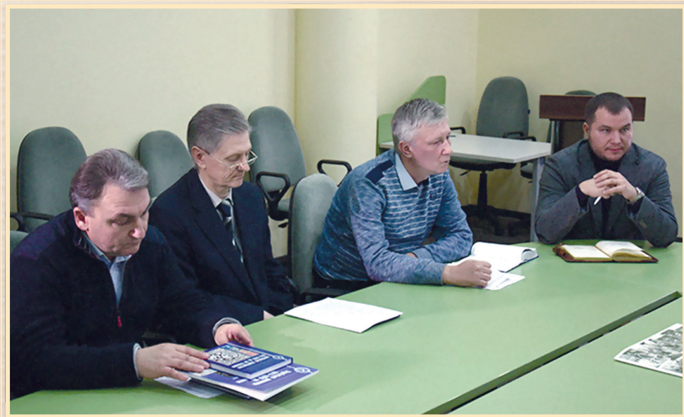
15 листопада 2017 р., Суми, Конгрес-центр СумДУ, засідання "круглого столу", присвяченого 100-річчю початку Української революції 1917–1921 рр.