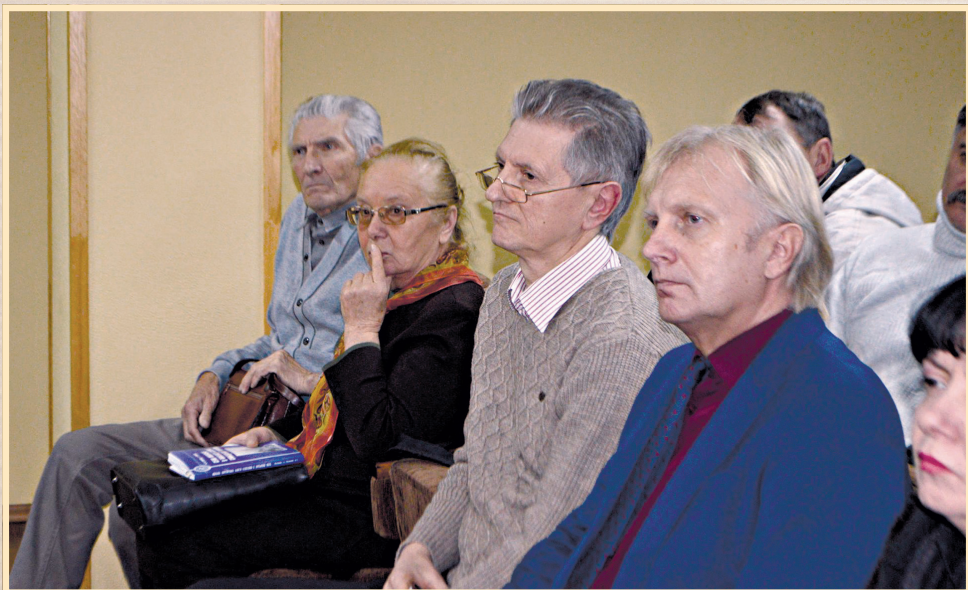
23 листопада 2017 р., Сумська обласна наукова бібліотека, відкриття виставки "Спротив геноциду" та "круглий стіл", присвячений темі Голодомору 1932–1933 рр. в Україні