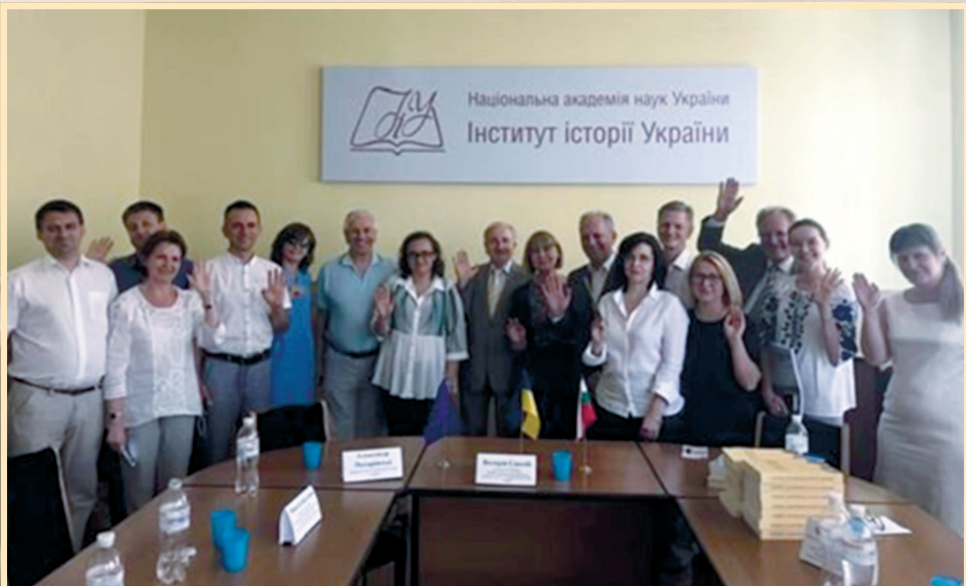
19 червня 2019 р., Київ, Інститут історії України НАН України, міжнародний круглий стіл "Україна і Болгарія: наукова співпраця заради взаєморозуміння"