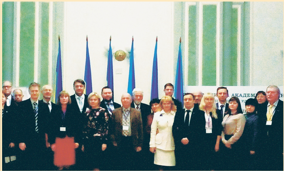
30 листопада 2017 р., Київ, Дипломатична академія України ім. Г.Й. Удовенка при МЗС України, учасники презентації щорічника "Україна дипломатична", вип. 18.