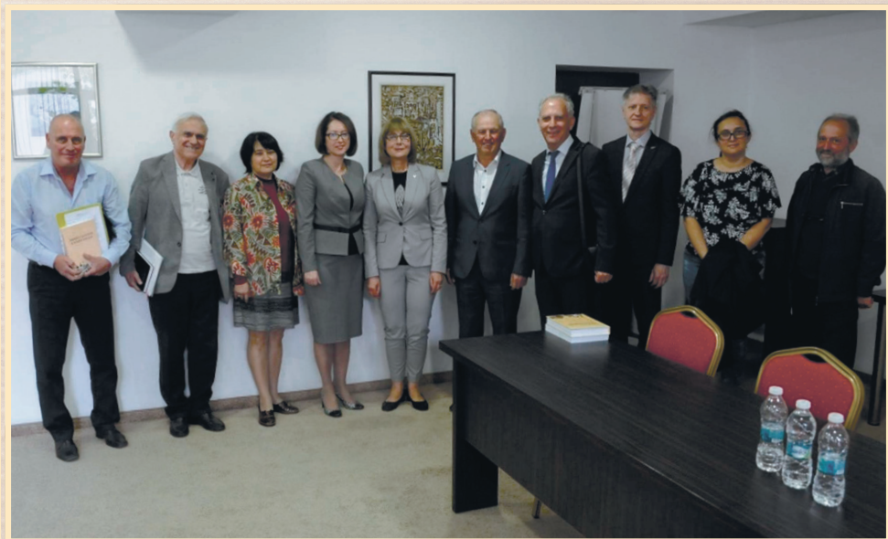
18 жовтня 2019 р., Пловдив, Регіональне відділення Болгарської академії наук, учасники презентації наукового збірника "Україна і Болгарія в історії Європи"