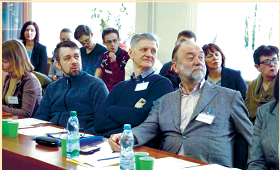
17 квітня 2019 р., Київський університет імені Бориса Грінченка, круглий стіл "Українська діаспора: напрямки, осередки, виклики"