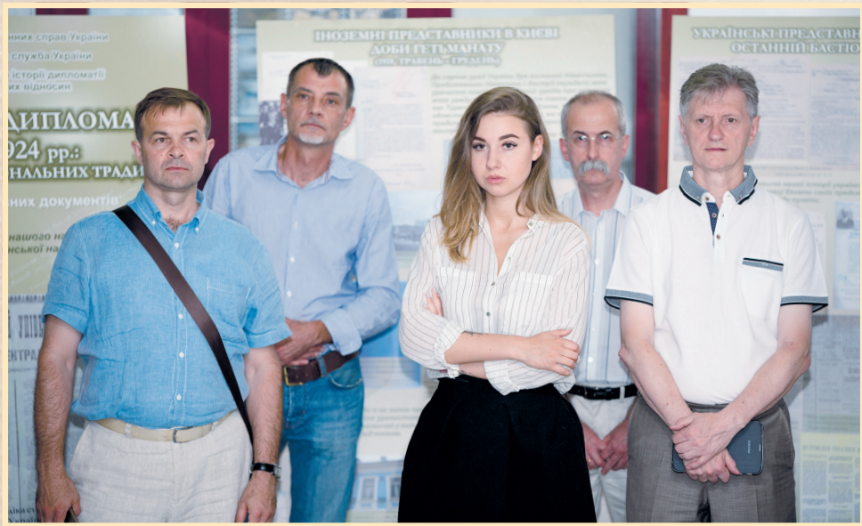
15 червня 2018 р., АН Молдови, відкриття виставки з нагоди 100-річчя української дипломатії