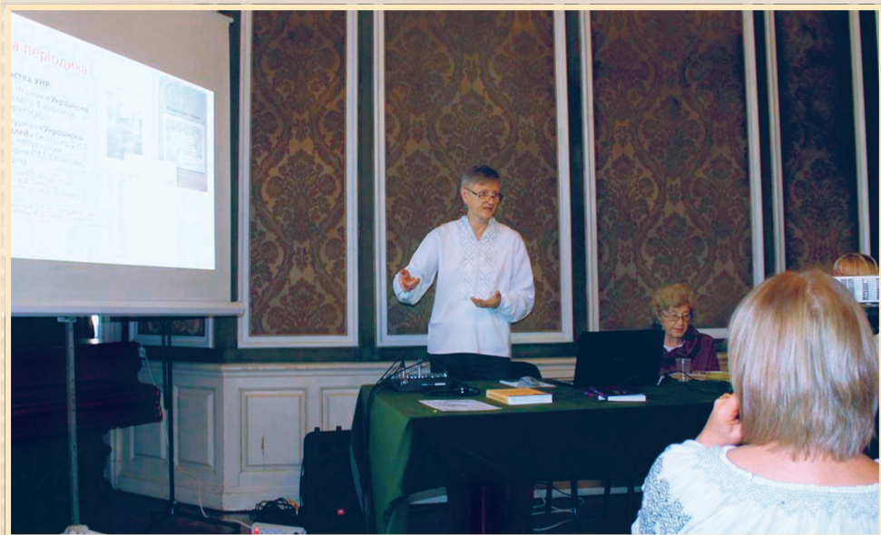
16 жовтня 2019 р., Софія, Етнографічний музей Болгарії, під час доповіді на XIV Міжнародній науковій конференції "Драгоманівські студії"