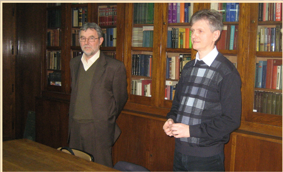
16 лютого 2011 р., Белград, лекція на кафедрі слов'янської філології Белградського університету