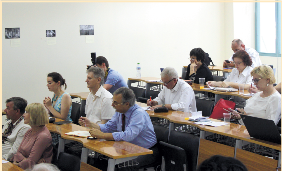
21 червня 2018 р., Салоніки, Міжнародний грецький університет