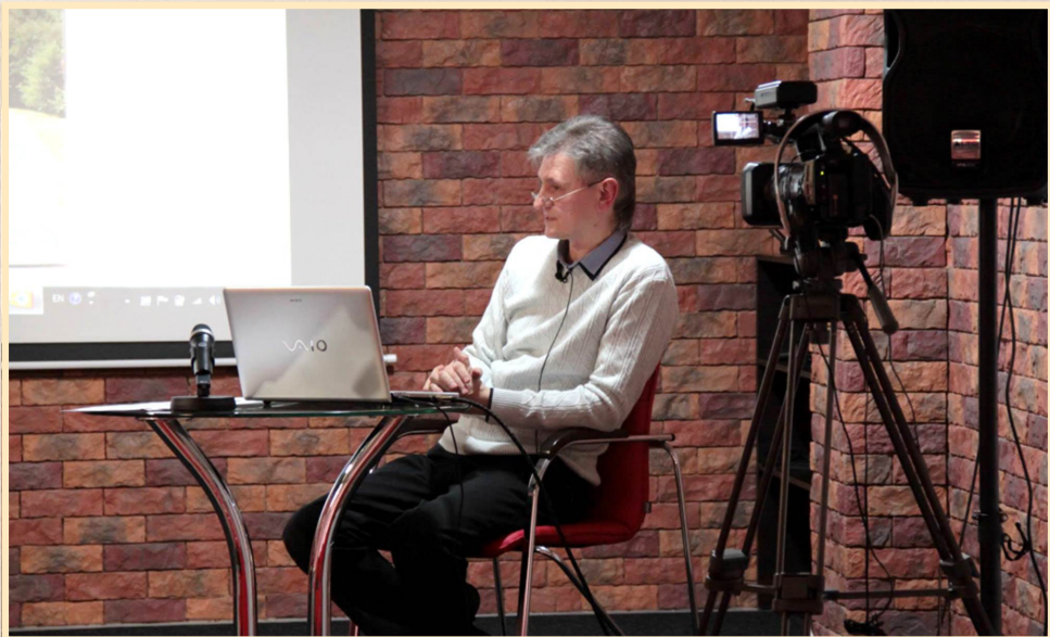
21 березня 2014 р., Суми, інтернет-телебачення "SumyNews". Публічна лекція "До 75-річчя проголошення незалежності Карпатської України"