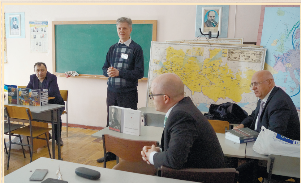
28 квітня 2017 р., Одеський національний морський університет, Міжнародна наукова конференція "Південь України: етноісторичний, мовний, культурний та релігійний виміри". Презентація книг