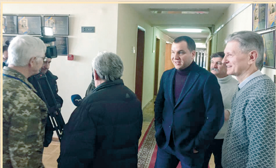
11 січня 2019 р., Сумська обласна державна адміністрація, виставка портретів діячів Української революції 1917–1921 рр. — уродженців Сумщини