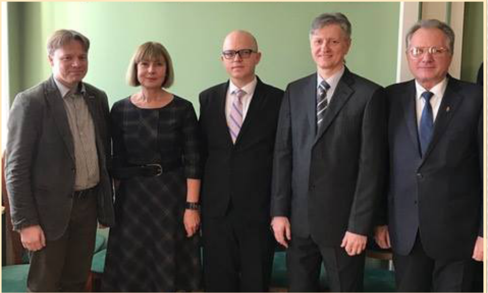
9 лютого 2017 р., Київ, Дипломатична академія України ім. Г.Й. Удовенка при МЗС України, презентація книги "Anchetat de SMERȘ: asul SSI și liderul emigrației ucrainene din România în dosarele SBU, 1944–1947"