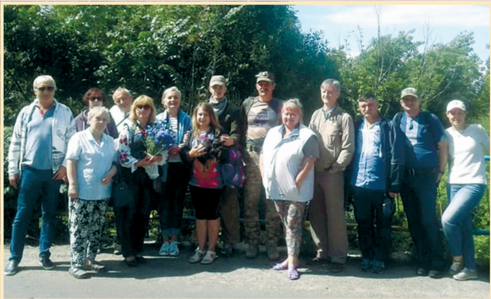
29 червня 2019 р., с. Шаповалівка, учасники конференції, присвяченої 360-річчю Конотопської битви