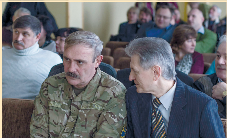
10 січня 2018 р., Сумська обласна наукова бібліотека, презентація серії книги, присвячених 100-річчю Української революції