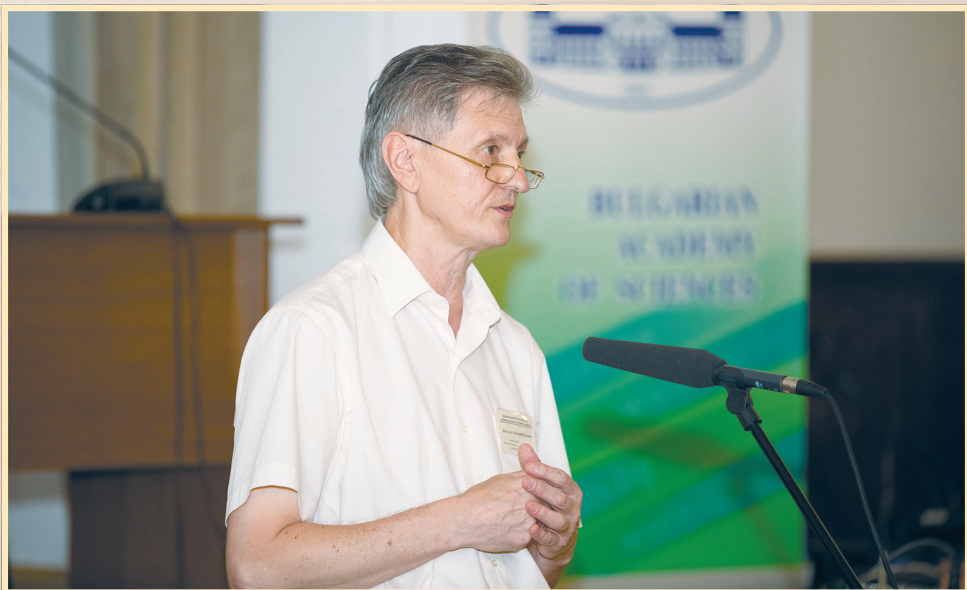
18 червня 2018 р., Софія, Болгарська Академія наук, виступ на конференції з нагоди 100-річчя встановлення українсько-болгарських дипломатичних відносин