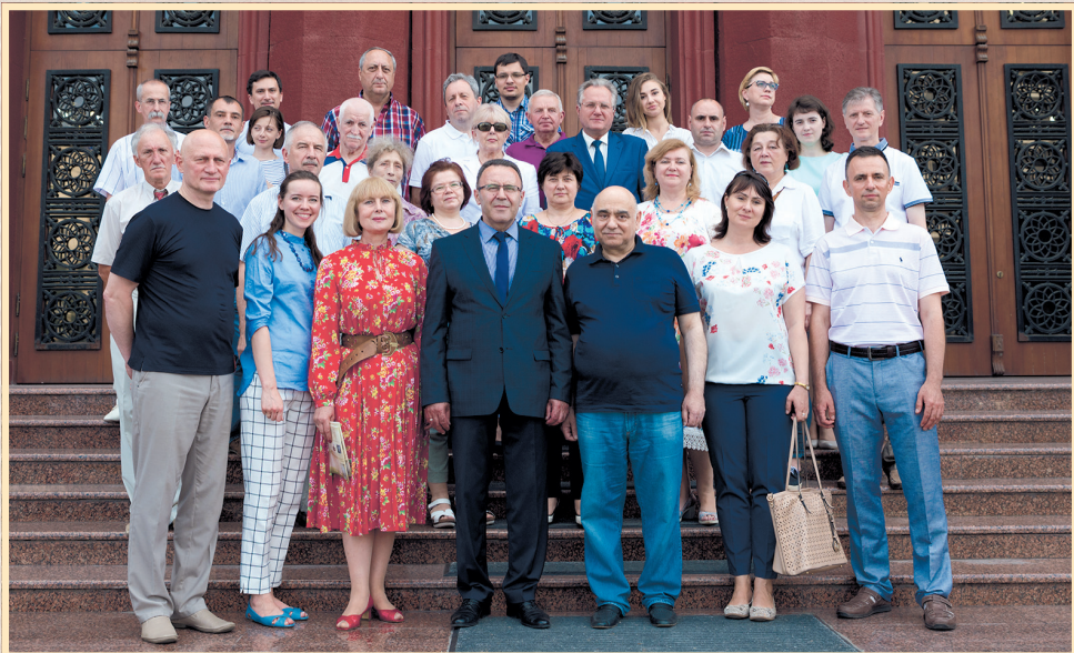
15 червня 2018 р., АН Молдови, відкриття виставки з нагоди 100-річчя української дипломатії