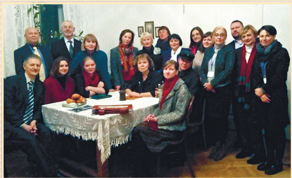
29 листопада 2017 р., Київ, Історико-меморіальний музей Михайла Грушевського