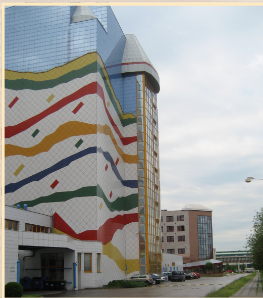
11 травня 2009 р., Прага, Національний архів Чеської Республіки