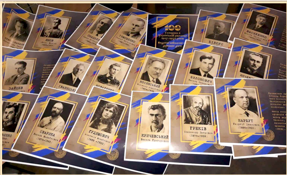
11 січня 2019 р., Сумська обласна державна адміністрація, виставка портретів діячів Української революції 1917–1921 рр. — уродженців Сумщини