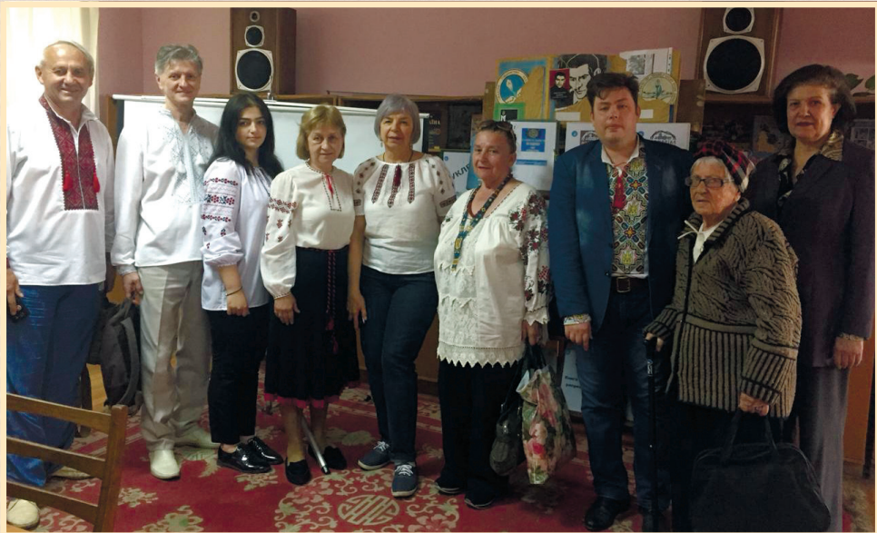
16 травня 2019 р., бібліотека-філія №17 Сумської центральної міської бібліотеки ім. Т. Шевченка, зустріч членів обласної організації Всеукраїнської правозахисної організації «Меморіал» імені Василя Стуса із громадськістю