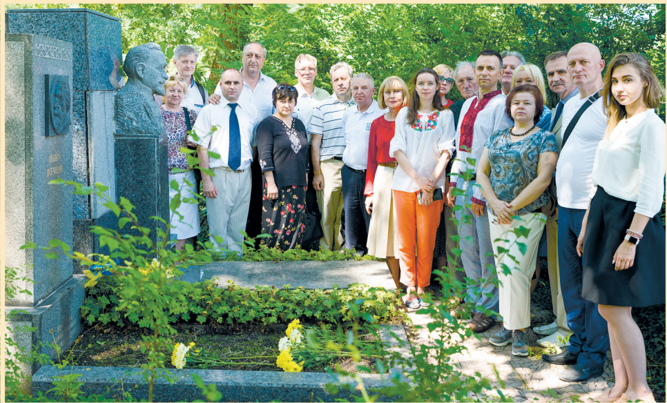
19 червня 2018 р., Софія, Вшанування пам'яті М. Драгоманова, міське кладовище