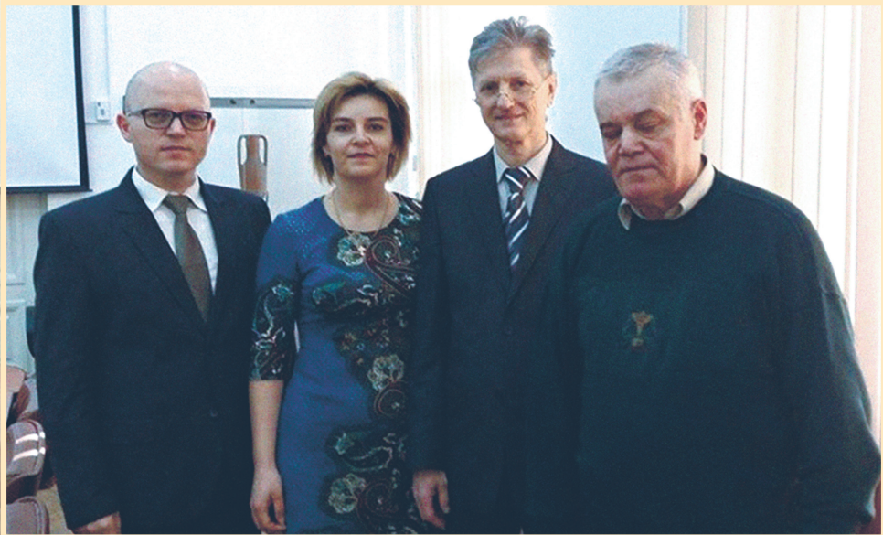
30 березня 2017 р., Бухарест, VII Міжнародна наукова конференція "Комунізм в Румунії", з колегами з Румунії та Молдови