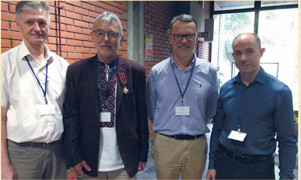
22 червня 2019 р., Новий Сад (Сербія), II Карпатський симпозиум — VII Міжнародна наукова конференція, присвячена історії і сучасності, матеріальній і духовній культурі бойків, гуцулів, лемків і русинів