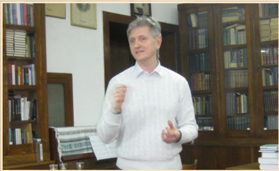
18 листопада 2016 р., Белград (Сербія), Міжнародна наукова конференція "Україністика і слов'янський світ", презентація