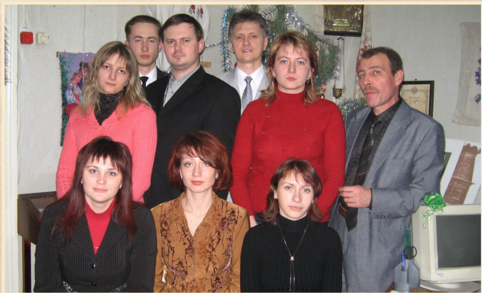
Червень 2006 р., Суми, Центр історичного краєзнавства Сумського державного університету