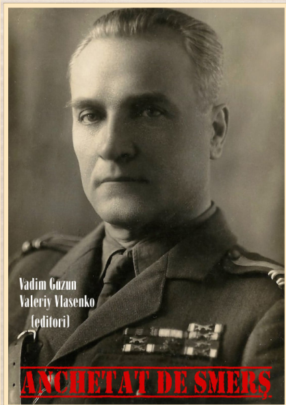
Обкладинка книги, що побачила світ у жовтні 2016 р. в м. Клуж-Напока (Румунія)