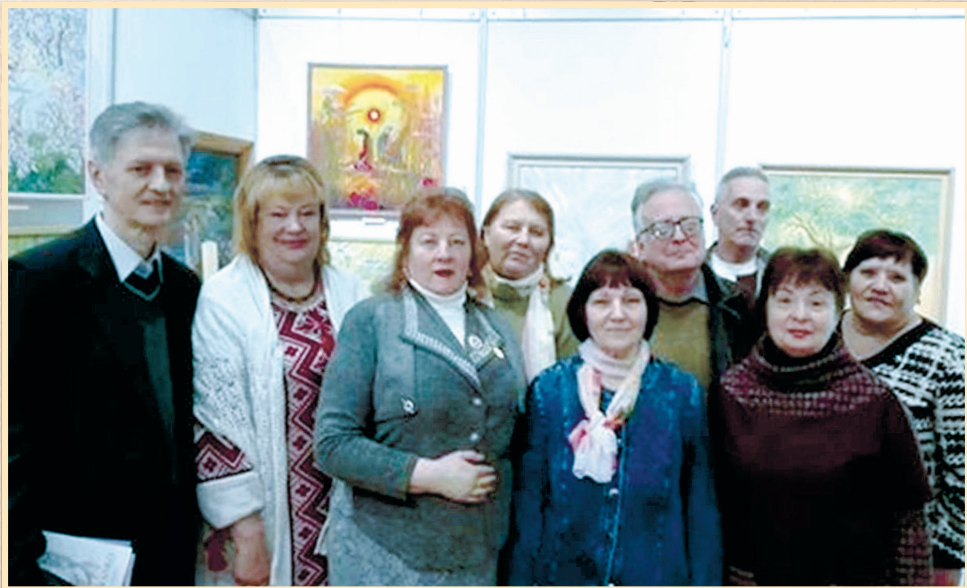
3 грудня 2018 р., Сумський обласний художній музей ім. Н. Онацького, учасники круглого столу з нагоди 140-річчя від дня народження Олександра Олеся