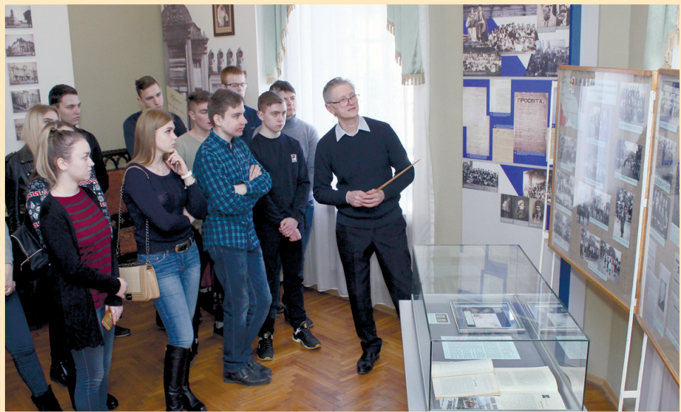
13 березня 2019 р., Сумський обласний краєзнавчий музей, відкриття виставки, присвяченої 80-річчю Карпатської України