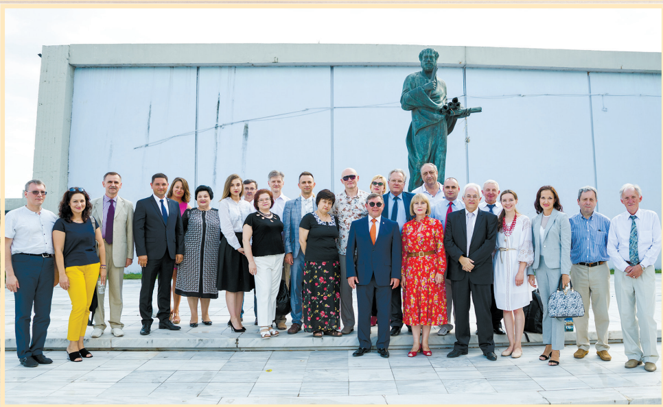
20 червня 2018 р., Салоніки, Університет Аристотеля, напередодні панельної дискусії про українсько-грецькі відносини