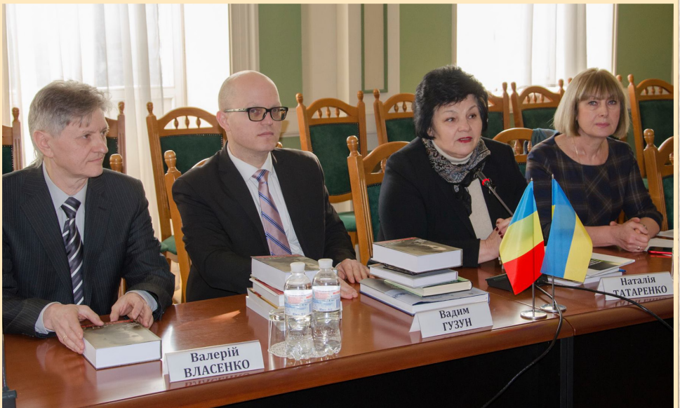
9 лютого 2017 р., Київ, Дипломатична академія України ім. Г.Й. Удовенка при МЗС України, презентація книги "Anchetat de SMERȘ: asul SSI și liderul emigrației ucrainene din România în dosarele SBU, 1944–1947" ("Під слідством СМЕРШ: Офіцер ССІ і лідер української еміграції в Румунії за матеріалами СБУ, 1944–1947").