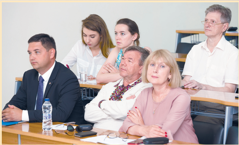
21 червня 2018 р., Салоніки, Міжнародний грецький університет