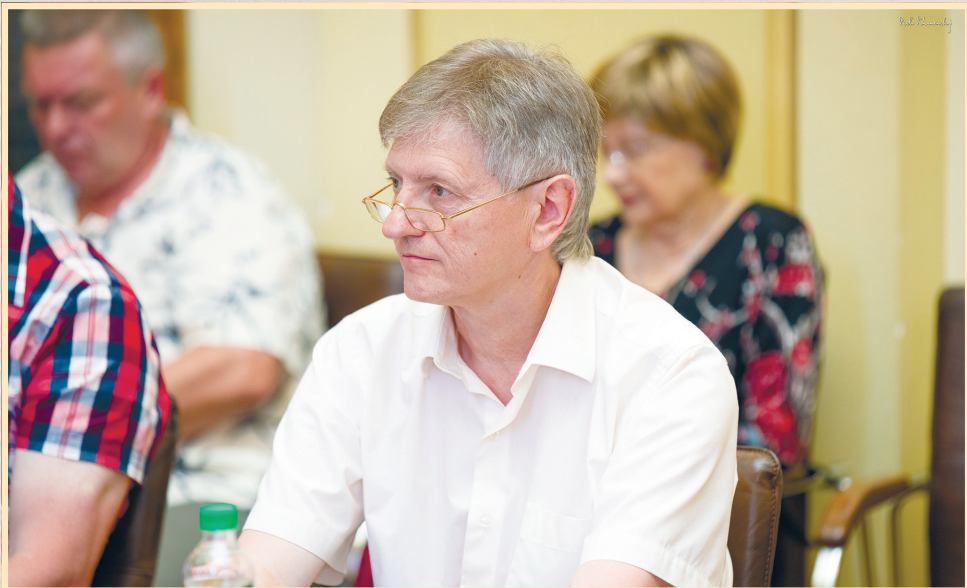
25 червня 2018 р., Бухарестський університет, круглий стіл, присвячений 100-річчю встановлення українсько-румунських дипломатичних відносин