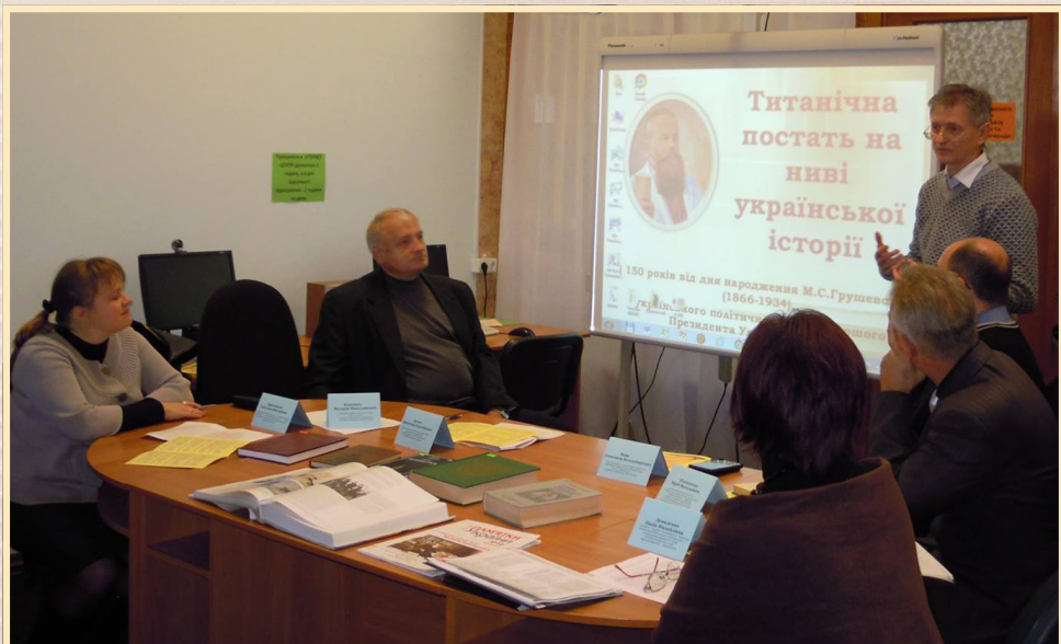
12 жовтня 2016 р., Сумська обласна наукова бібліотека, наукові краєзнавчі діалоги "Сумчани в колі Михайла Грушевського"