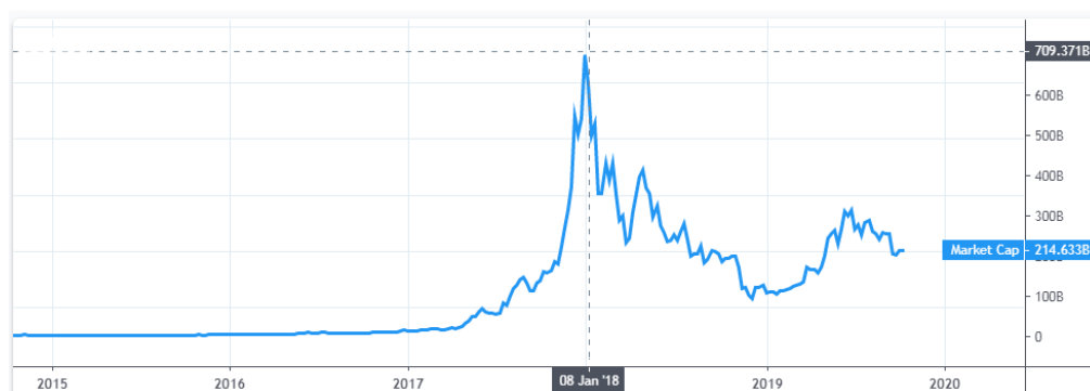
Рисунок 1 – Загальна ринкова капіталізація криптовалют [25]

Зростання обсягів капіталізації криптовалют відбувалося експоненціально, із вибуховою динамікою у 2017-18 рр. Так, на початку березня 2014 року загальна капіталізація оцінювалася в 3,8 млрд дол. США, на початку 2017 року — 17,9 млрд дол. США, на початку 2018 року — близько 700 млрд дол. США. Після того динаміка котирувань увійшла в зону високої волатильності (рис. 1).