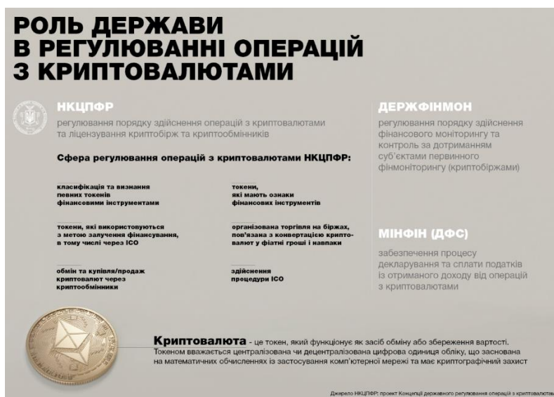
Рисунок 3 – Роль держави в регулюванні операцій з криптовалютами

клірингових операцій та розрахунків. Крім того, НБУ визначає структуру валютного ринку України та організовує торгівлю валютними цінностями на ньому відповідно до законодавства України про валютне регулювання (стаття 45 Закону №679). Статтею 32 Закону №679 визначено, що випуск та обіг на території України інших грошових одиниць і використання грошових сурогатів як засобу платежу забороняється.