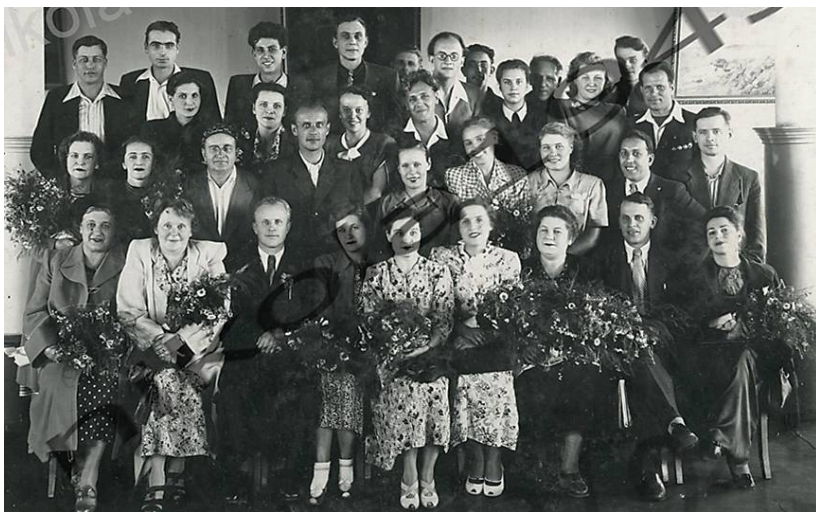
Віра Павлівна Редліх з артистами трупі Новосибірського театру "Красный факел" (сидить у першому ряду друга зліва). Фото 1951 року.

театр ім. Горького та викладає в Білоруському театральному інституті, з 1966 р. - професор кафедри акторської майстерності. З 1956 року – народна артистка Російської Федерації. Нагороджена трьома орденами, а також медалями. Померла у 1992 році, похована у Мінську.