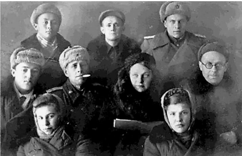
Високогірна експедиція в м. Нарин під керівництвом видатного клініциста М.П.Редлиха (крайній праворуч). 1948 рік.

Після війни працював у Киргизії, де з науковою експедицією вивчав патофізіологічні зміни на організм людини в умовах високогір'я, потім у Володимирі, де очолював терапевтичне відділення обласної лікарні. Помер у 1971 р. [25, 26, 27].