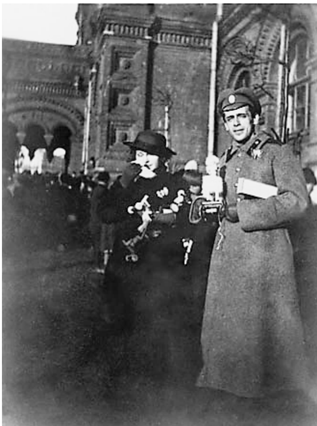
Сергій Ефрон (чоловік М.Цветаєвої) та Віра Редліх. Москва. 1917рік.

Віра Редліх товаришувала з Аллою Тарасовою (українська актриса, народна артистка СРСР), після війни запросила у свій театр Євгенія Матвєєва, який тільки-но прийшов з фронту.