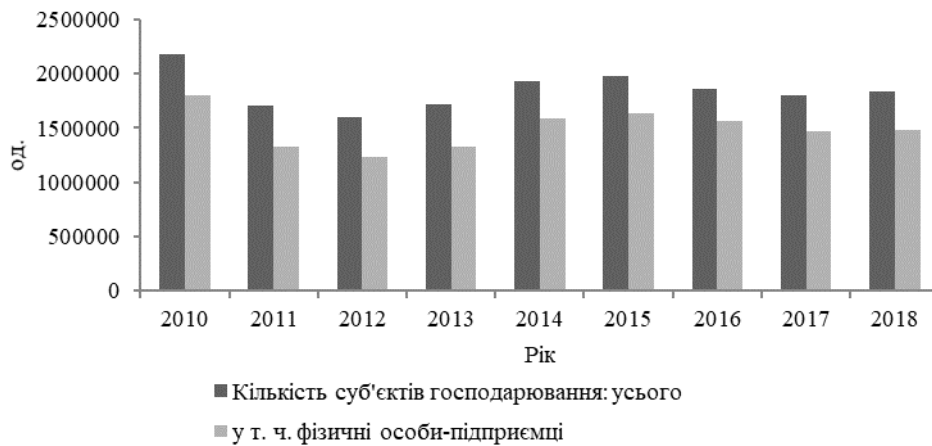
Рисунок 2 – Динаміка кількості суб'єктів господарювання в Україні протягом 2010-2018 рр., од. [7]

Динаміка кількості суб'єктів господарювання в Україні протягом 2010-2018 рр. представлено на рисунку 2.