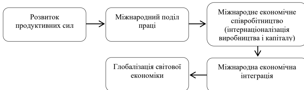
Рисунок 1 – Етапи глобалізації світової економіки [2]

І. Г. Владимірова представляє процеси, які ведуть до економічної інтеграції та глобалізації, у вигляді взаємозалежних етапів, які відображені на рисунку 1. Безперечно ці складові дещо спрощено характеризують процес глобалізації світової економіки, оскільки в реальності надто складно виділити ці етапи в чистому вигляді, можна виявити тільки певні тенденції. Глобалізація на макроекономічному рівні сприяє економічній активності країн та міжнародних об'єднань через послаблення інвестиційних та торгівельних бар'єрів, створення зон вільної торгівлі тощо [2].