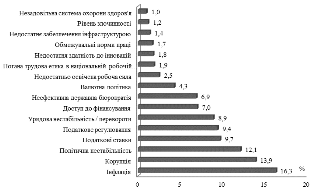
Рисунок 5 – Проблемні фактори ведення бізнесу в Україні у 2018 р., % [8]

Таким чином, найбільшою проблемою для розвитку українського бізнесу суб'єкти господарювання вважають високий інфляційний тиск. Варто відмітити, що за даними Держкомстату, середньорічна інфляція в 2018 р. порівняно з минулим роком зменшилася на 3,5 % та становила 10,9 %. Незважаючи на таке зниження показника, інфляція все ще продовжує залишатися найбільш загрозливим чинником для нормального розвитку українського бізнесу. На другому місці з показником 13,9 % перебуває фактор корумпованості. Так у 2018 р. рівень хабарництва та корупції збільшився з 56 % у 2016 р. до 73 %. При цьому, у світі лише 25 % респондентів відповіли, що їх організації стикалися з випадками хабарництва та корупції, що майже втричі менше у порівнянні з українськими організаціями.