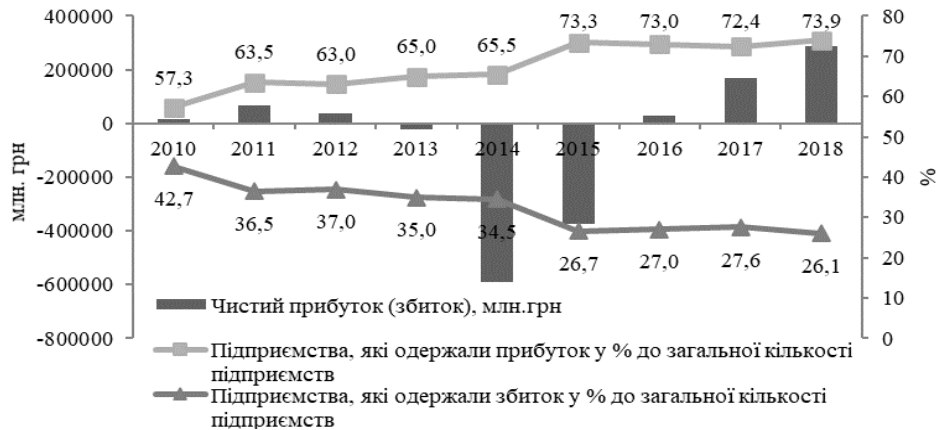
Рисунок 4 – Чистий фінансовий результат діяльності підприємств України протягом 2010-2018 рр. [7]

У 2018 р. порівняно з 2010 р. чистий фінансовий результат діяльності підприємств України збільшився на 274,4 млрд. грн. та дорівнював 288,3 млрд. грн. Зазначимо, що активне пожвавлення у обсягах чистого фінансового результату спостерігається з 2016 р., у якому вперше зі збитків 2013-2015 рр. підприємства країни спрацювали на 29705 млн. грн. Зокрема, рекордний обсяг негативного фінансового результату діяльності протягом аналізованого періоду спостерігається у 2014 р. зі значенням 590,1 млрд. грн.