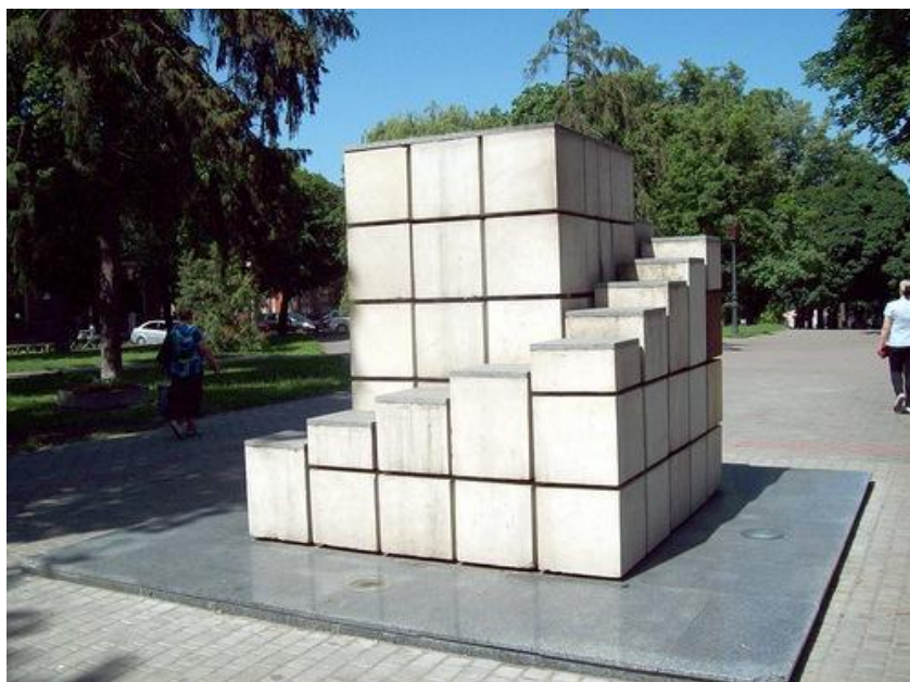
Мал. 7. Пам'ятник цукру-рафінаду.