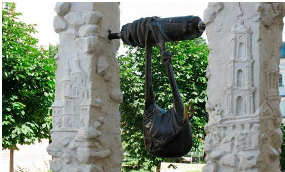
Мал. 2. Фонтан-пам'ятник «Сумка».