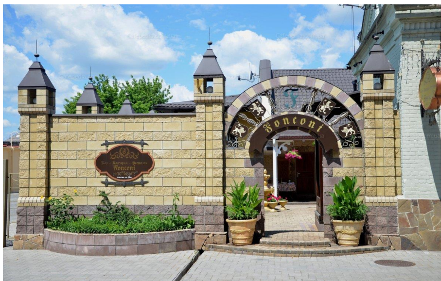
Мал. 8. Італійський ресторан «Фонконі».