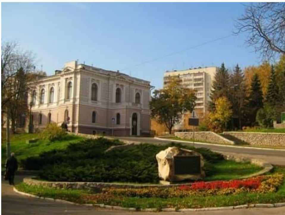
Мал. 6. Художній музей імені Н. Онацького.