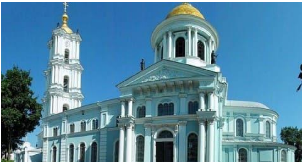
Мал. 4. Спасо-Преображенський кафедральний собор.