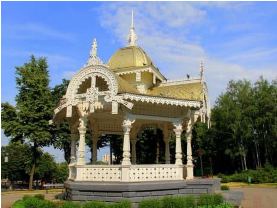
Мал. 5. Альтанка.