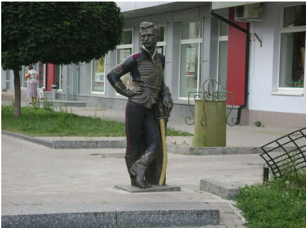
Мал. 3. Пам'ятник Гусару.