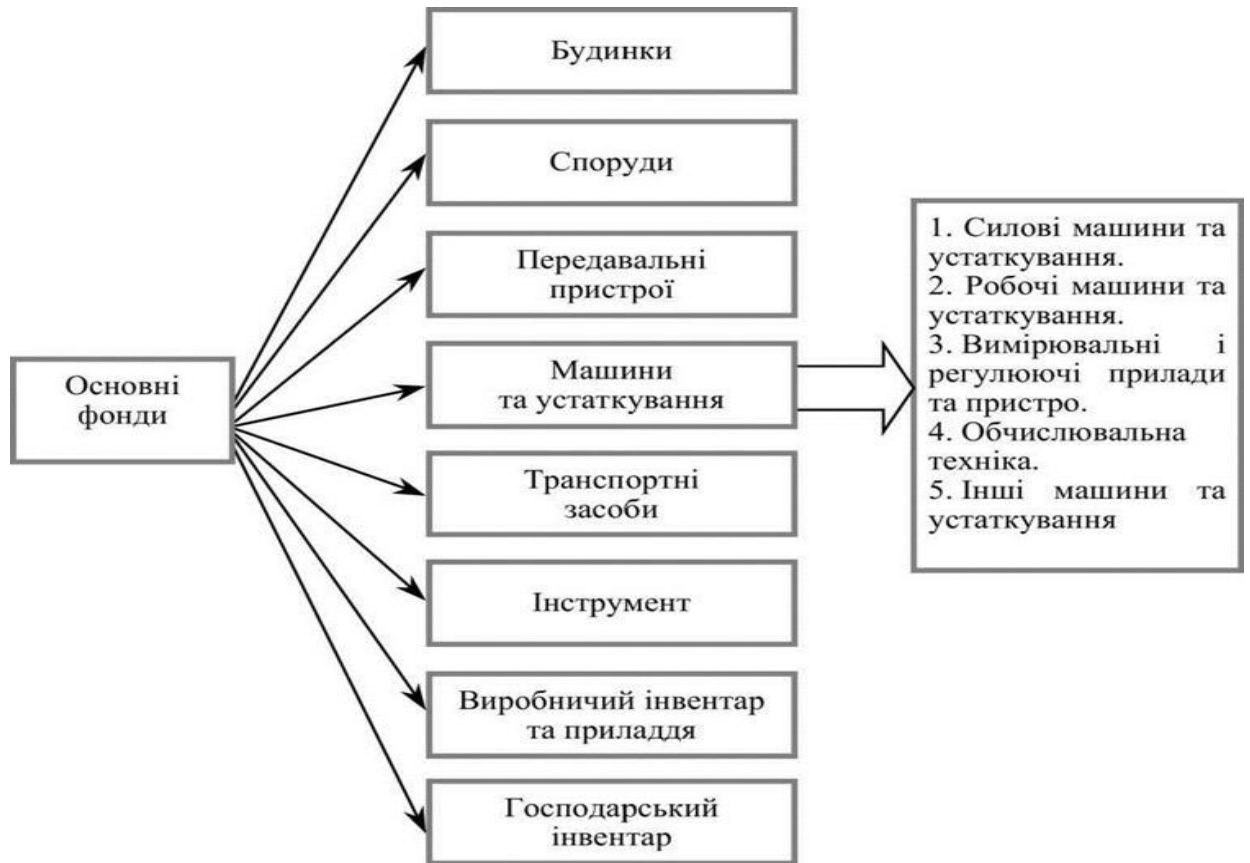
Рисунок 1.2 Видова класифікація основних фондів

Для покращення виробничої структури основних фондів можливе впровадження таких заходів: оновлення та модернізація устаткування; механізація та автоматизація виробництва; вірна розробка проектів будівництва та високоякісне виконання планів будівництва підприємств; ліквідація обладнання, що не використовується та встановлення обладнання, що забезпечить ефективніші пропорції між його окремими групами [17].