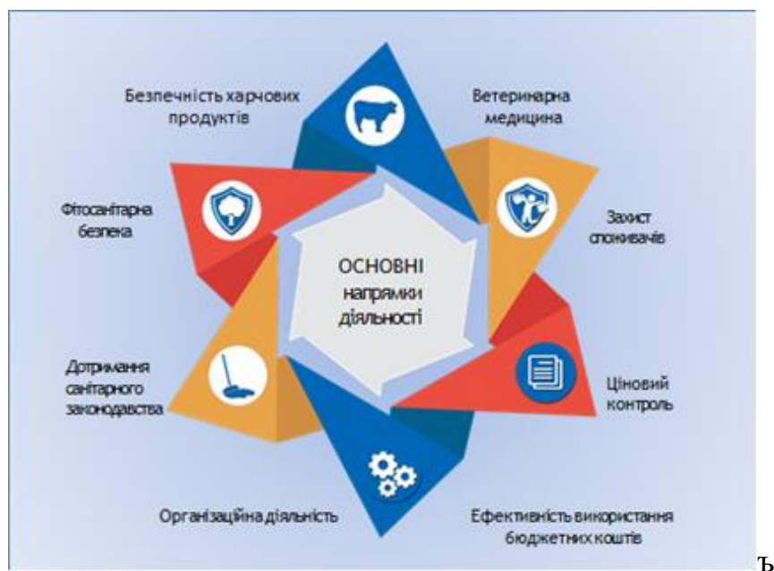
Рис. 1.1. Основні напрями діяльності Держпродспоживслужби

насіництва та розсадництва, здійснення державного контролю за якістю зерна та продуктів його переробки, здійснення державного нагляду (контролю) за додержанням заходів біологічної і генетичної безпеки щодо сільськогосподарських рослин під час створення, дослідження та практичного використання генетично модифікованого організму у відкритих системах на підприємствах, в установах та організаціях агропромислового комплексу незалежно від їх підпорядкування і форми власності, здійснення радіаційного контролю за рівнем радіоактивного забруднення сільськогосподарської продукції і продуктів харчування. [ 2 ]