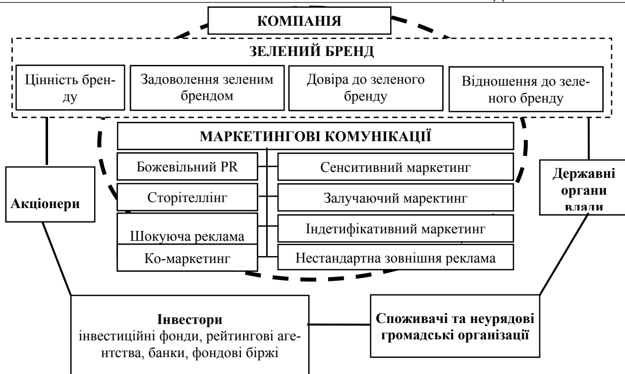
Рис. 2 Концептуальна модель взаємодії компанії зі стейкхолдерами у рамках концепції формування зеленого бренду

Слід відмітити, що аналіз зарубіжного досвіду свідчить, що ефективно діючий ринок зелених інвестицій забезпечує отримання ряд переваг для всіх секторів економіки. З метою виокремлення переваг для вітчизняної економіки від розвитку ринку зелених інвестицій було використано модифіковано функцію економічного зростання (формула 1).