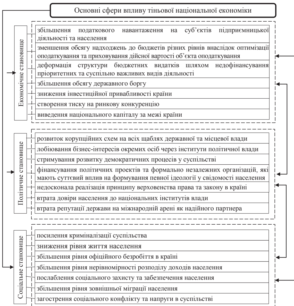
Рис. 2. Основні сфери впливу тіньової національної економіки на економічне, соціальне та політичне становище в країні

Отже, функціонування тіньової економіки здійснюється в умовах складної взаємодії комплексу чинників економічного, політичного та соціального характеру. Всі фактори впливають на систему і визначають її поведінку. За цих умов вирішено кількісно оцінити ступінь та напрям зв'язку тіньових операцій із трьома основними сферами суспільного життя за допомогою структурного моделювання.