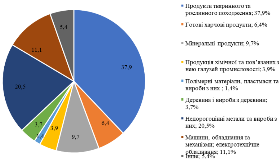
Рисунок 1 – Розподіл товарних груп за експортом України 2019 року