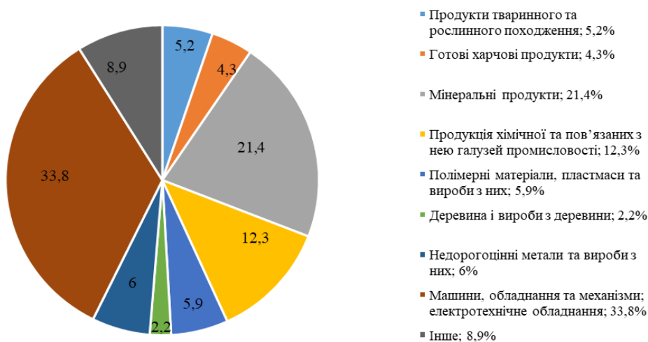
Рисунок 2 – Розподіл товарних груп за імпортом України 2019 року Джерело: побудовано авторами за статистичними даними.

Найбільші частки експорту товарних груп у 2019 році становили продукти тваринного та рослинного походження (37,9 %) і недорогоцінні метали та вироби з них (20,5 %). А найменші з наведених – продукція хімічної та пов'язаних з нею галузей промисловості (3,9 %), деревина і вироби з деревини (3,7 %) та полімерні матеріали, пластмаси і вироби з них (1,4 %). Що стосується імпорту товарних груп, найбільшу частку становлять машини,