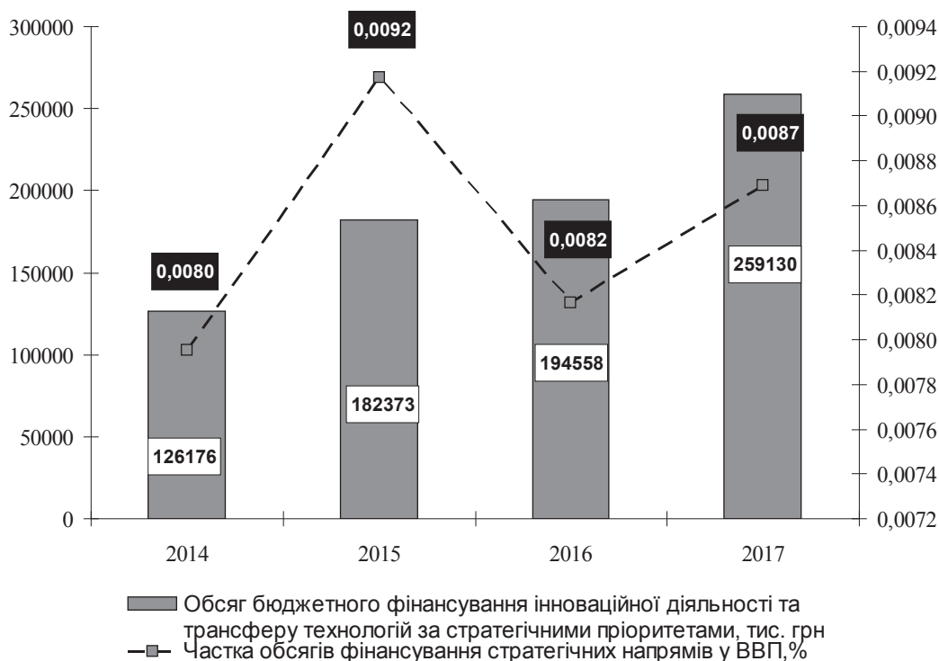
Рис. 1. Динаміка бюджетного фінансування інноваційної діяльності та трансферу технологій за стратегічними пріоритетами, 2014-2017 рр.

Дослідження сучасного стану фінансування інноваційної діяльності у стратегічних секторах