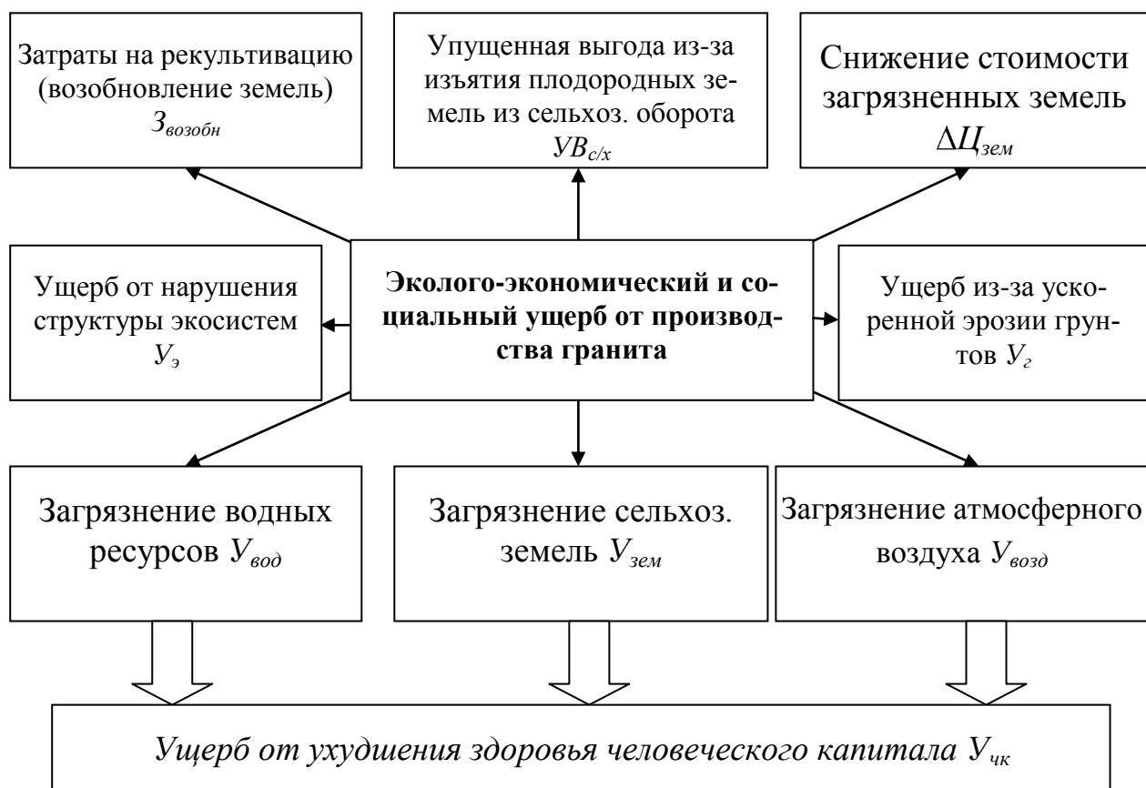
Рис. 2. Виды эколого-экономического и социального ущерба при производстве гранита.

Вывод. Таким образом, весь процесс производства природного камня нуждается в глубоком изучении и усовершенствовании, на что указывают экодеструктивные процессы и экономические потери, связанные с его производством. Важным направлением государственного регулирования деятельности предпринимателей, которые работают в этой области, является решения очерченного круга проблем. Это будет содействовать ускорению развития гранитного бизнеса в странах СНГ, повышению качества предлагаемой продукции, росту конкурентоспособности за счет естественного богатства и увеличению эффективности производства.