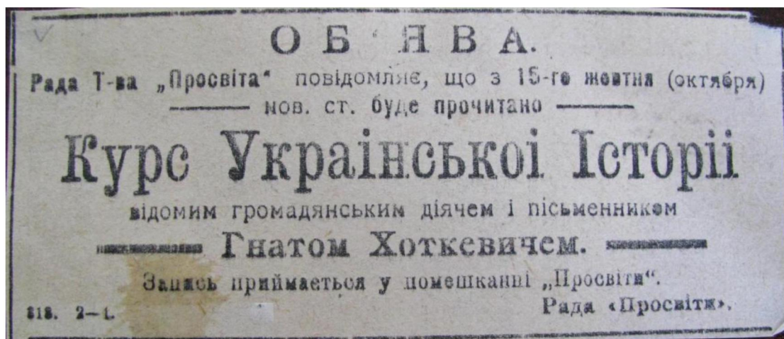
Оголошення в сумській газеті «Луч» про відкриття «Просвітою» курсів української історії, жовтень 1918 р.

Ну, а всього у Сумському повіті 1917–1918 рр. діяло шість осередків Товариства: в Сумах, Білопідлі, Стецьківці, Юнаківці, Нижній та Верхній Сироватці. Найдовше з них проіснувала Юнаківська «Просвіта» – до 1921 р.