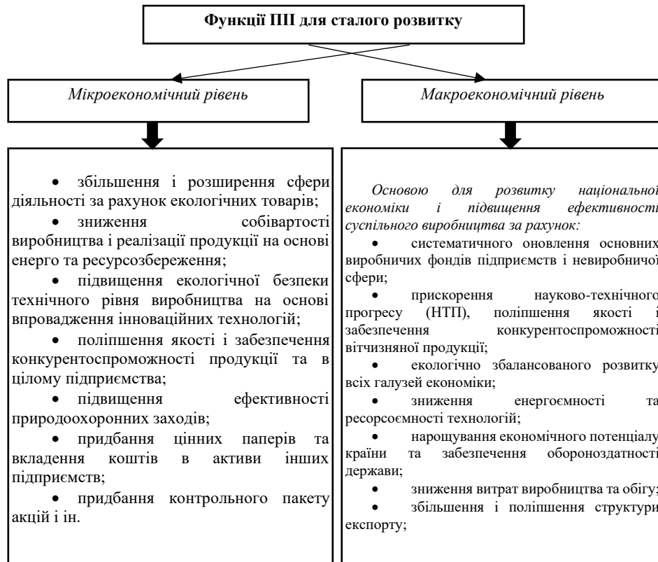
Рисунок 2– Роль ІІІ для сталого розвитку країни (сформовано авторами)

Підводячи підсумок, ми наголошуємо, що інвестування в сучасні підприємства є важливою складовою як розвитку окремої компанії, так і країни в цілому. Залучення інвестицій призведе до збільшення економічних показників, науково-технічного прогресу, швидкого економічного зростання та ефективного використання ресурсів, з одного боку та дозволить забезпечити досягнення цілей сталого розвитку, з іншого боку.