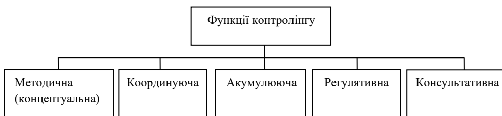
Рисунок 1. – Функції контролінгу [14,16,17]

Оскільки цілі підприємства залежать від безлічі факторів, то і функції контролінгу може бути величезна кількість, вони постійно доповнюються і змінюються за змістом. Перелічимо основні функції контролінгу: