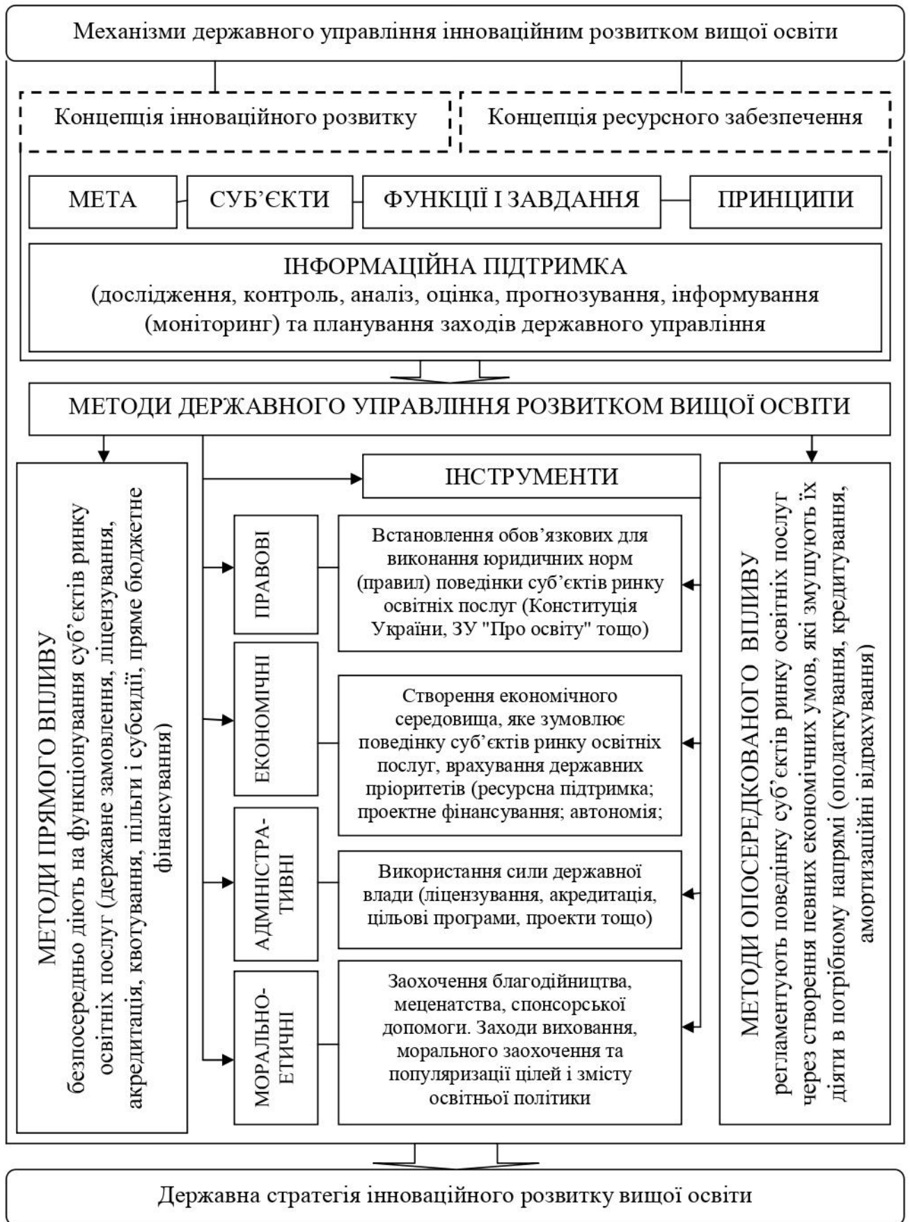
Рисунок 3.1. Концептуальна схема функціонування механізмів державного управління інноваційним розвитком вищої освіти