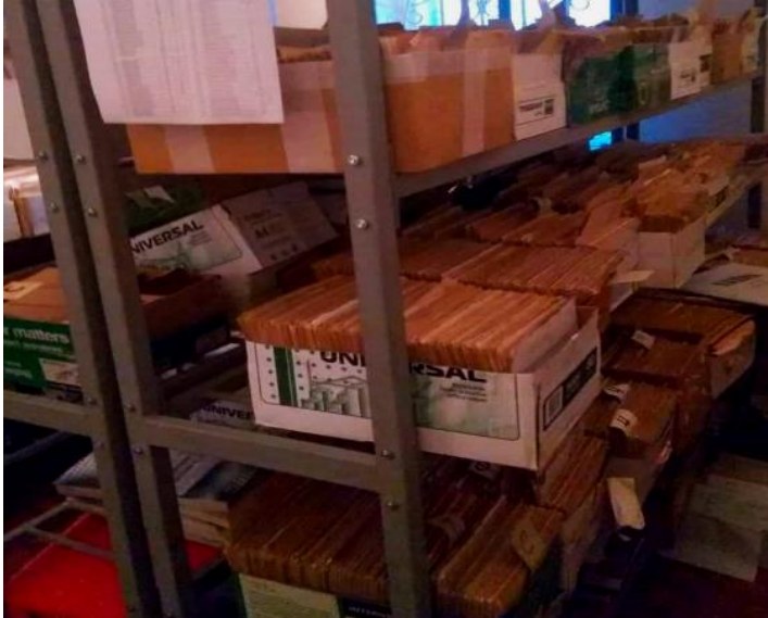
Рис.3.2 - Приміщення архіву сектору реєстрації фізичних осіб та ведення реєстру територіальної громади ЦНАП Конотопської міської ради. Після закінчення відведеного терміну розробляється розпорядження керівником ЦНАП, складається Акт про знищення документів.

Чи взаємодіє Сектор під час виконання покладених на нього завдань з підприємствами, установами та організаціями, що розташовані на території, на яку поширюються повноваження міської ради, надає рекомендації з питань, що належать до його компетенції?