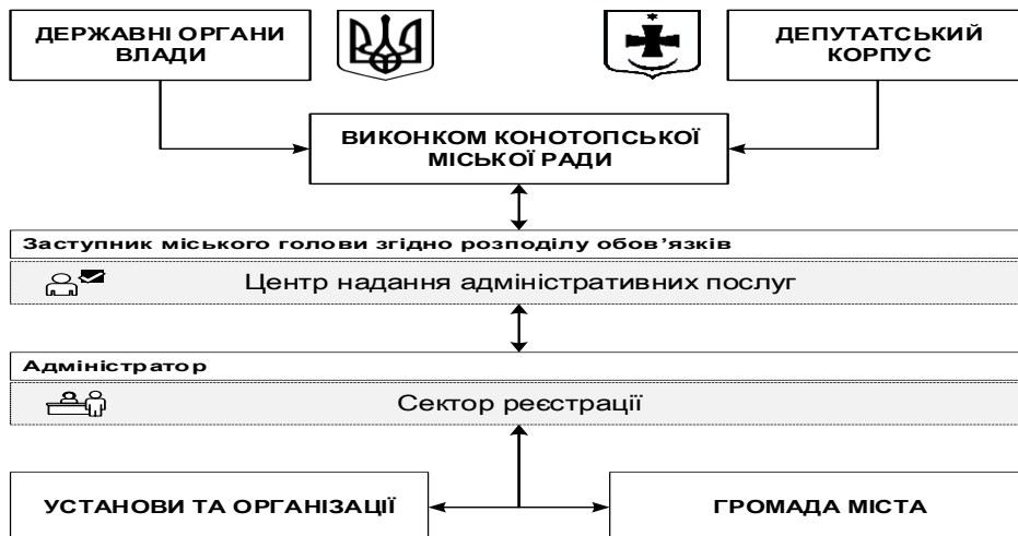
Рис.3.1 - Схема комунікаційного зв'язку центру надання адміністративних послуг Конотопської міської ради

Сектор є важливою ланкою в організації ефективної роботи ЦНАПу.