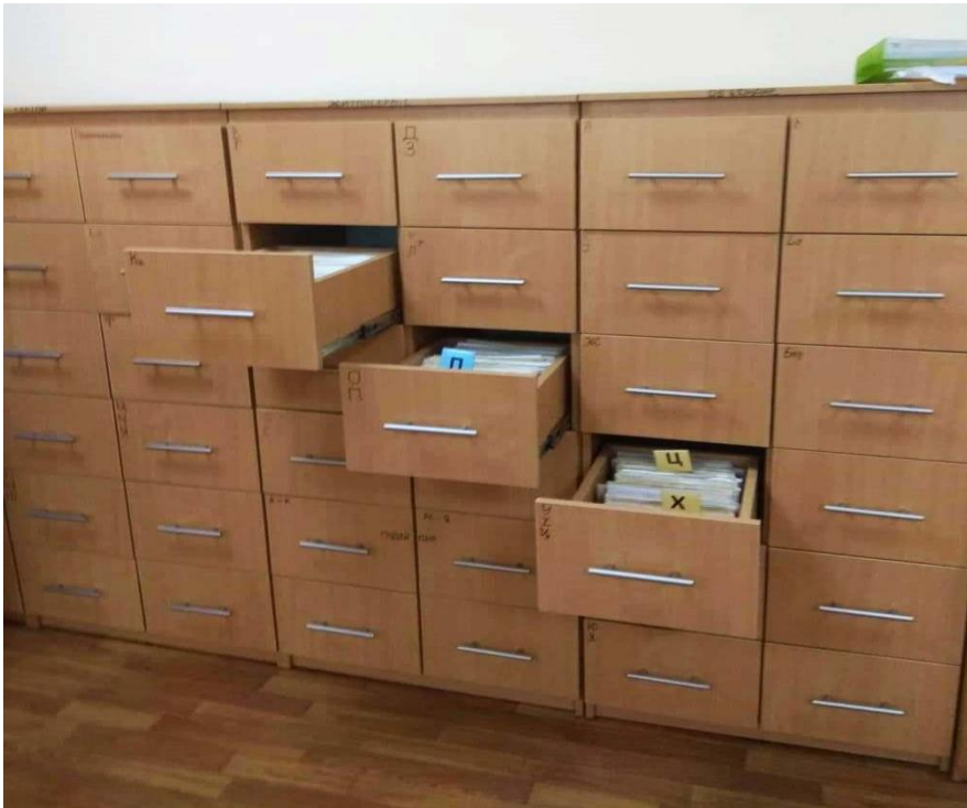
Рис.3.1 - Картотечна шафа зберігання діючих карток реєстрації фізичних осіб

архівні (при знятті з реєстрації). Кожна картка містить персональні дані громадянина, адресу зареєстрованого місця проживання та дату реєстрації.