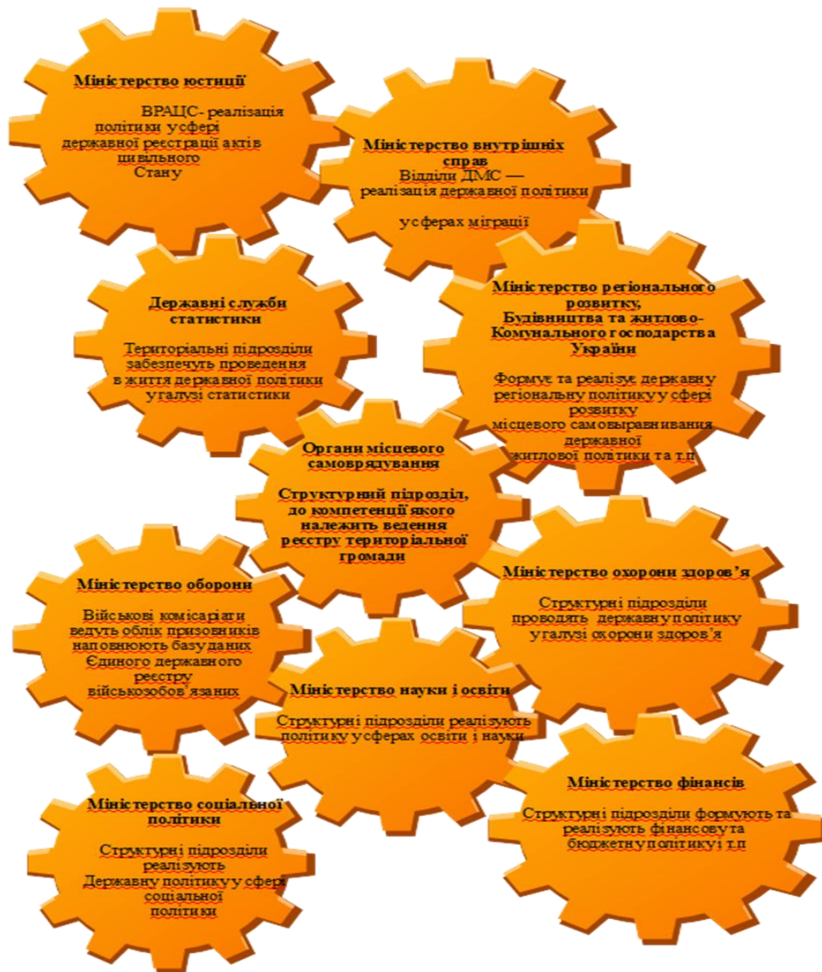
Рис.3.3- Загальна схема єдиної інформаційної системи електронного обліку персональних даних та міграційних процесів

Здійснюючи державне управління, органи влади повинні враховувати зростання ролі громадянського суспільства і вносити відповідні корективи, визначаючи стратегічні цілі власного удосконалення і плануючи заходи передовсім у внутрішній політиці, механізм реалізації якої безпосередньо взаємодіє із складовими громадянського суспільства.