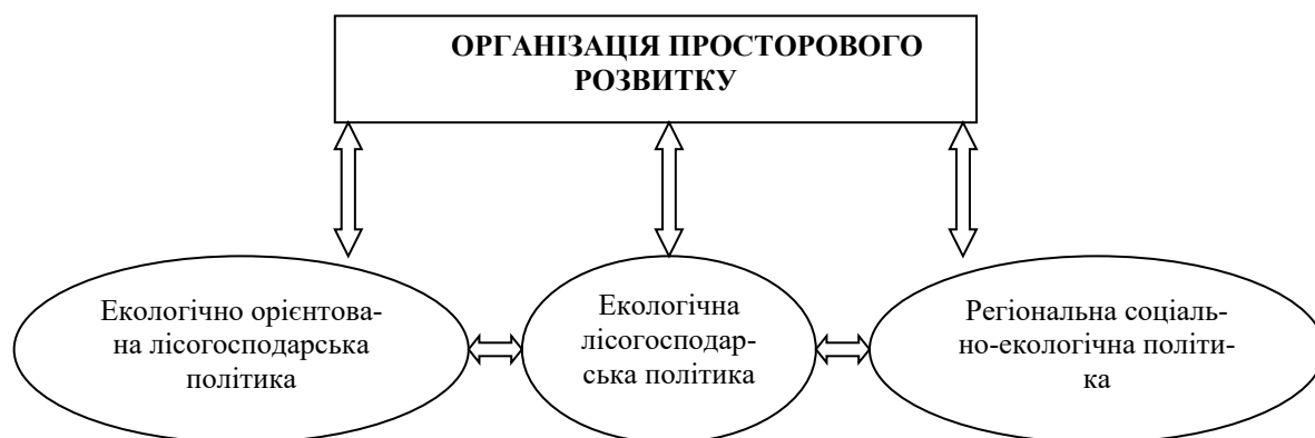
Рис. Взаємозв'язок соціально-екологічної політики в регіоні та екологічно орієнтованої лісової політики

Взаємозв'язок соціально-екологічної та лісової політики умовно представлена на рис.