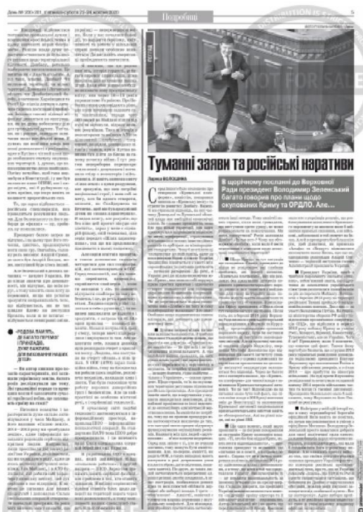
Рис. 4 – Приклад фотографії до матеріалу «Туманні заяви та російські нарративи».

Фото об'єкта – це зображення одного чи групи предметів, коли головним завданням є показати сам предмет). Це можуть бути фото товарів, про які йдеться, якихось цікавих речей, які читач раніше не бачив. Тобто це фотографії, де зображений сам предмет без прив'язки до місця і часу. Це є вид ілюстративних зображень, які самі не можуть "розповідати" читачеві історію; зрозуміти, чому саме цей предмет тут зображений і чим він має бути цікавим, найчастіше можна зрозуміти лише з журналістського матеріалу.