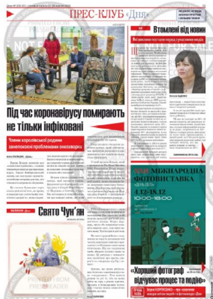
Рис. 6 – Приклад фотографії до матеріалу «Свято Чун’ян».