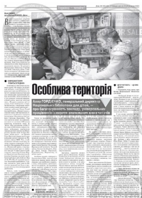
Рис. 3 – Приклад фотографії до матеріалу «Особлива територія».

«Як протилежність постановочної, в ній категорично не допускається будь яка організація, режисура. Це фотографія, яку робить "невидимий" фотограф "невидимою" камерою. Існують два основних способи такої зйомки: метод прихованої камери і метод звичної камери. У першому випадку фотограф робить все можливе, щоб залишитися непоміченим, а в другому - не ховається, але чекає того моменту, коли люди перестануть реагувати на його присутність» [17, С.43]. Їхня основна функція – візуально підтвердити те, про що написано в журналістському матеріалі.