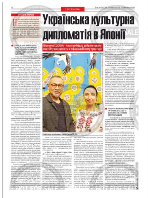
Рис. 2 – Приклад фотографії до матеріалу «Українська культурна дипломатія в Японії».