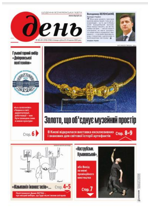
Рис. 1 – Приклад фотографії головної сторінки газети «День».

Фотопортрет може бути індивідуальним або груповим. Головне, щоб він не був дрібним і не спотворював зовнішність зображених на ньому людей.