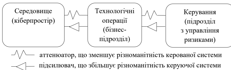
Рис. 1. Система відносин у процесі управління складністю системи відповідно до концепції VSM