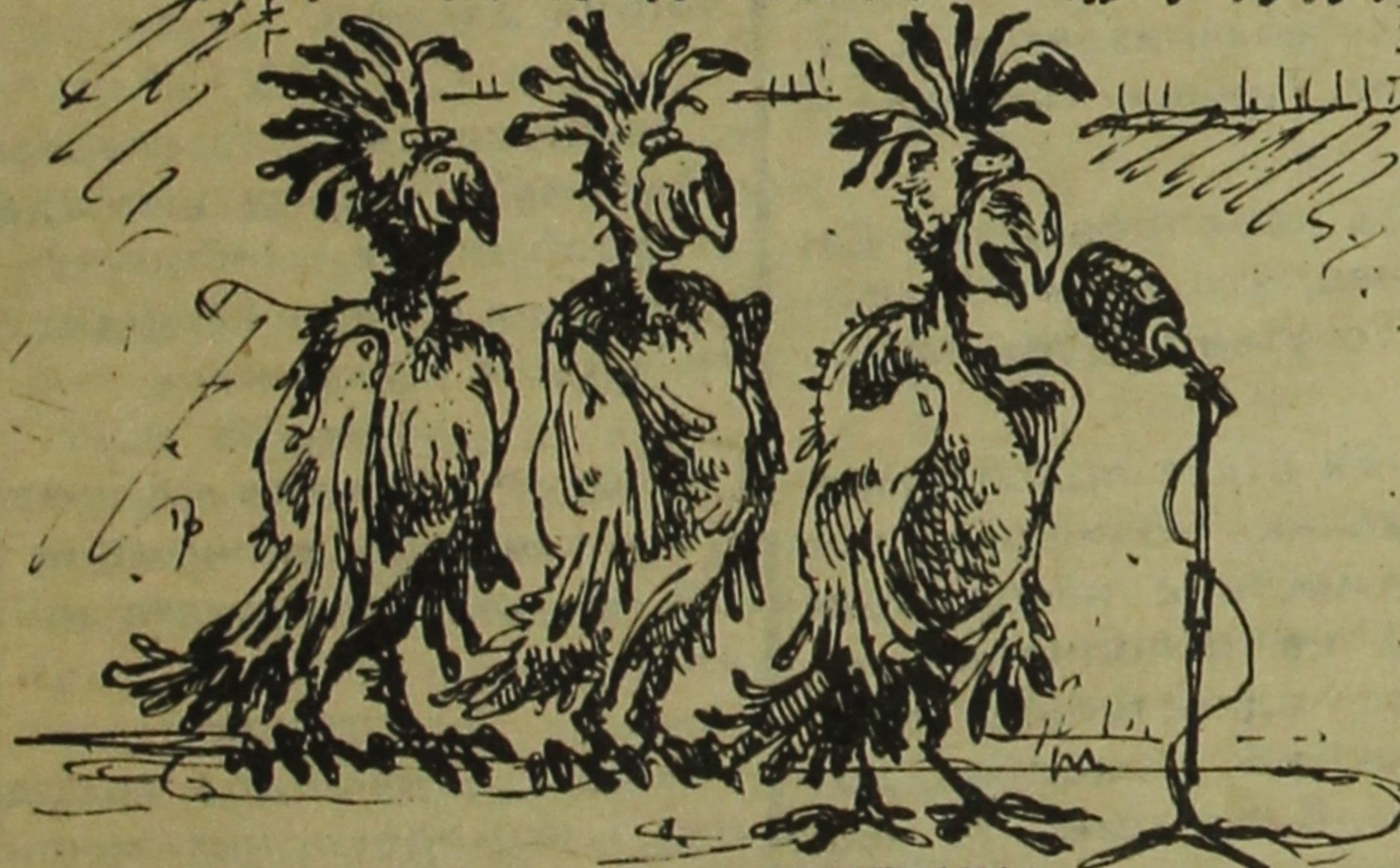
Малюнок М. ВОЛОВА та Б. ПИЛИПЕНКА.

(Продовження. Початок у першому числі «Резонансу»).