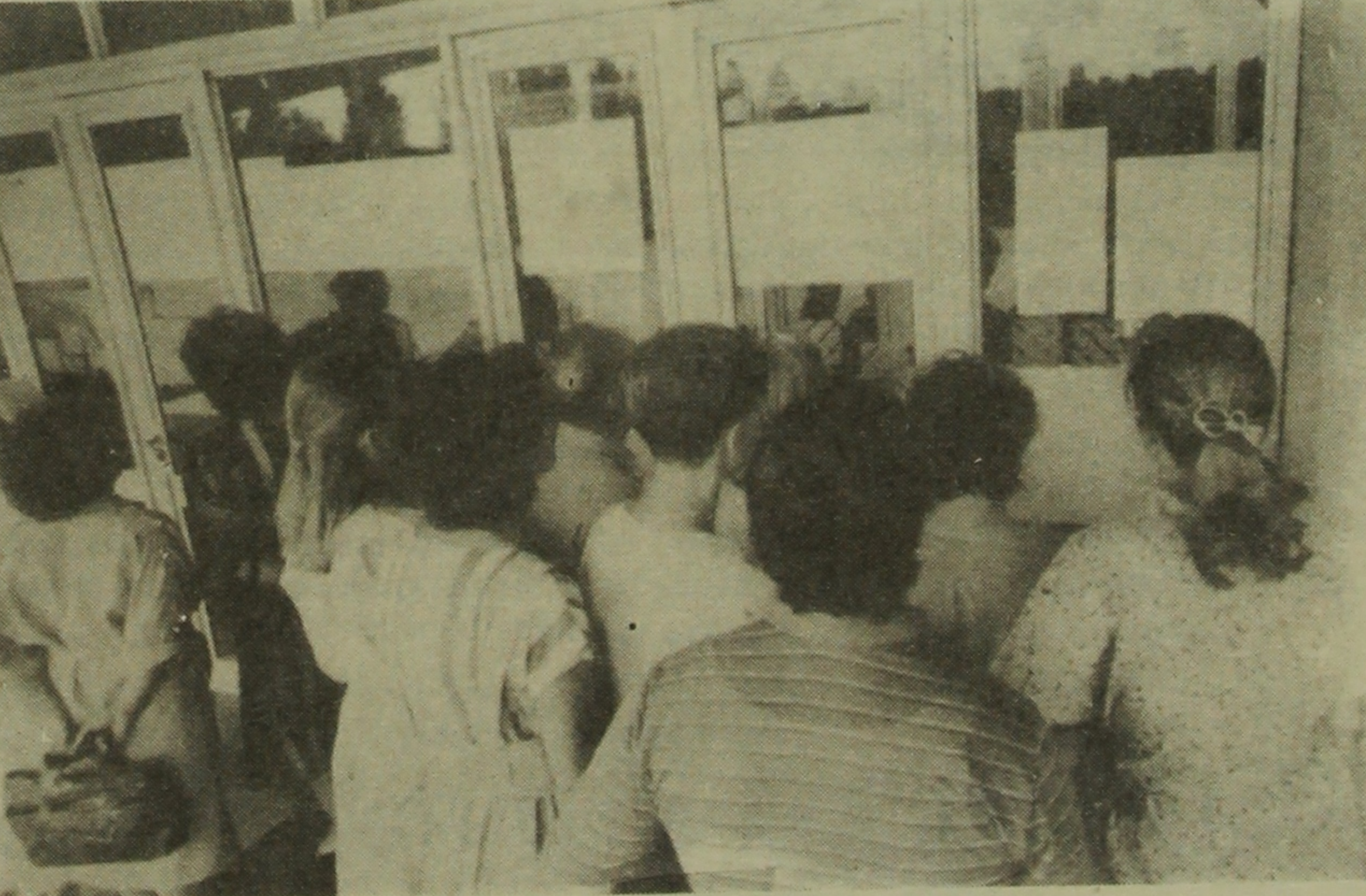
Завдання іспитів на факультеті економіки СумДУ. У цьому році іспити дуже змінилися.

З когорти випускників, наприклад, Кононського медичного училища виявилось 9 бажаччих стати лікарем, із яких 5 — червонодипломники. Студентом же став... аж 1.