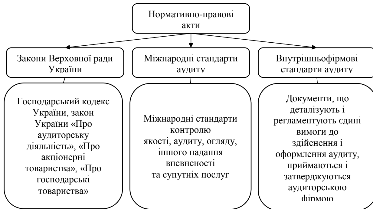
Рисунок 3 - Державне регулювання аудиторської діяльності та незалежного аудиту в Україні

Державне регулювання аудиту доходів та фінансових результатів характеризується дією нормативно-правових актів сфери аудиторської діяльності на діяльність суб'єктів аудиту. На рисунку 3 систематизовано нормативно-правові акти, які регламентують питання аудиторської діяльності в Україні.