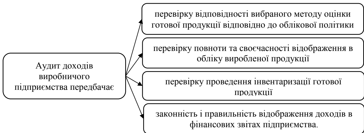
Рисунок 1 - Методика аудиту доходів виробничого підприємства

Аналіз рекомендацій вітчизняних і зарубіжних науковців щодо організації проведення аудиту доходів, викладених у науковій і методичній літературі, дозволив сформувавши послідовність основних його етапів (рис.1).