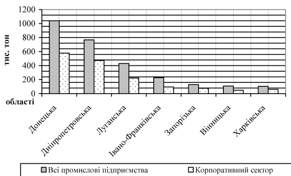
Рис. 3. Об'єми забруднення атмосферного повітря в регіональному розрізі підприємствами корпоративного сектора

Значна доля забруднення навколишнього середовища припадає саме на промисловість України. На жаль, на сьогоднішній день, зі збільшенням промислового виробництва, негативний вплив на природне середовище також збільшується. Щорічно в атмосферне повітря, водні та земельні ресурси країни потрапляє досить велика кількість небезпечних забруднюючих речовин (близько 60 млн. т), із них понад три чверті токсичні відходи. За нашими оцінками, на долю корпоративного сектора припадає приблизно 50–60 % викидів забруднюючих речовин у навколишнє середовище (рис. 3) [7, 9].