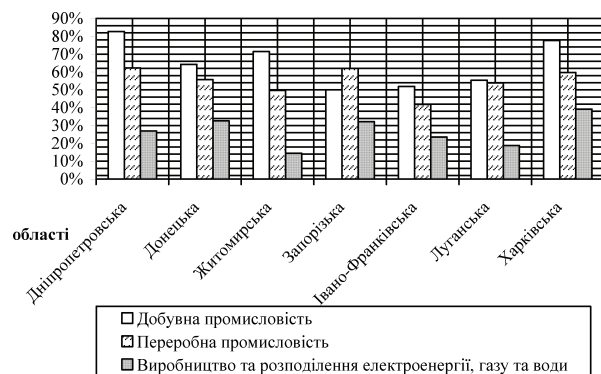
Рис. 1. Питома вага підприємств корпоративного сектора в промисловості в регіональному розрізі

Аналізуючи динаміку обсягів зареєстрованих комісією випуску ЦП за 2005–2009 роки, можна