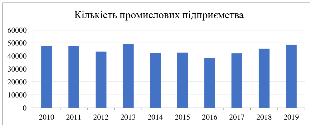
Рис. 2 – Динаміка розвитку промислових підприємств за 10 років, (од.)

стабілізацією економіки в Україні, завдяки іноземним інвестиціям кількість промислових підприємств зросла і у 2019 році становила близько 48604 одиниць. Для детального аналізу кількості збанкрутілих та ліквідованих підприємств розглянемо на рис.2.