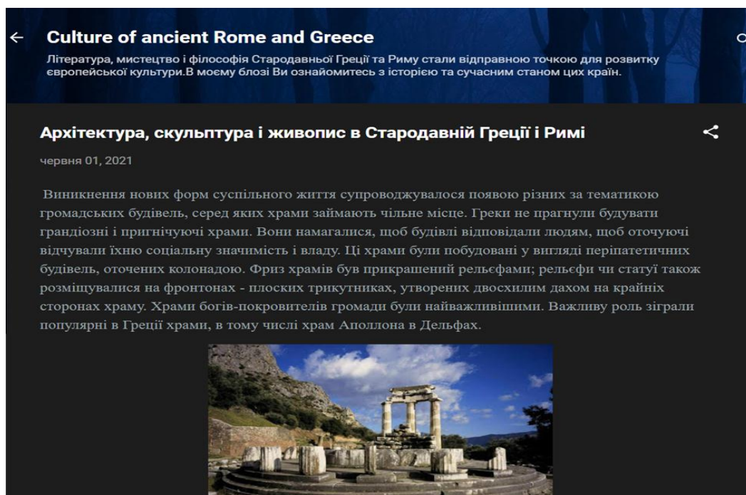
Додаток 6. Перший скріншот статті «Архітектура, скульптура і живопис в Стародавній Греції і Римі»