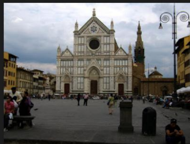
Міжнародна галерея Санта-Кроче

Живопис і скульптура - дві основні "робочі конячки" італійських музеїв. Любителі модернізму не залишаться без діла в Італії: Венеція, наприклад, пропонує прогулятися по залах колекції Гуггенхайма і знаменитої Міжнародної галереї Санта-Кроче, а Мілан відкриває двері цікавого музею науки і мистецтва, де, озброївшись лупами і шупами, можна навчитися відрізняти справжні картини від витончених підробок.