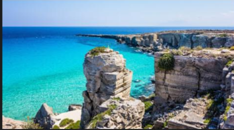
Красна бухта (Cala Rossa), Фавіньяна, Сицилія

Пляжі на італійському узбережжі муніципальні. Однак найчастіше вони розділені на ділянки і здаються в оренду підприємцям. На кожній ділянці є свій "баніно" - охоронець пляжу, який стежить за чистотою і порядком та стягує плату за користування парасольками і шезлонгами. Згідно з місцевими правилами, перші 5 метрів пляжу від кромки води безкоштовні: там ви можете засмагати на рушнику, не витрачаючи ні копійки.