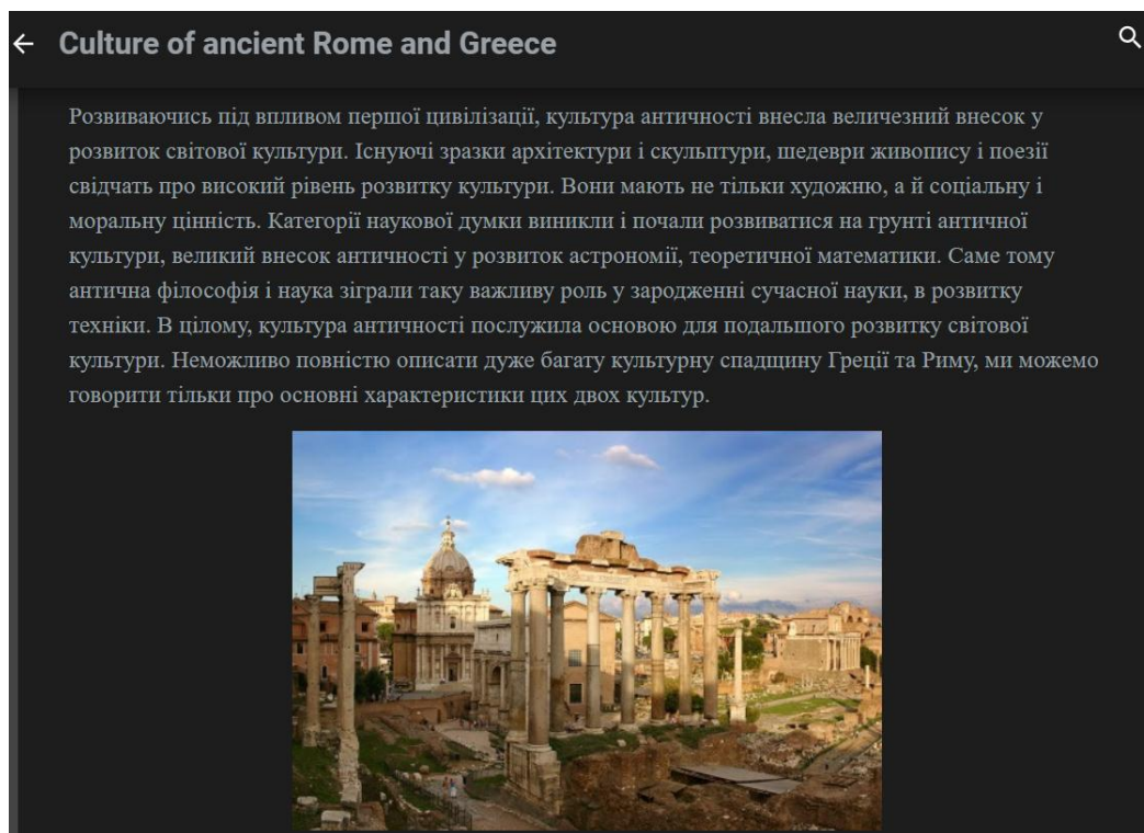
Додаток 2. Другий скріншот статті «Культура Давньої Греції та Риму»