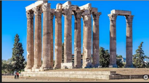
Храм Зевса Олімпійського

Майстрами римлян були етруски. Саме вони навчили будувати будівлі, але римляни швидко перевершили їх в цьому мистецтві. Стали краще використовувати раніше застосовувані матеріали, пристосовувати нові, удосконалювати методи будівництва.