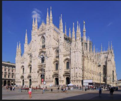
Кафедральний собор в Мілані, що присвячений різдву святої Діви Марії

В Італії соборів чи не більше, ніж музеїв, і якою б ви не вибрали, ви знайдете унікальний пам'ятник архітектури та інженерного мистецтва, та й просто дивовижної краси споруди. Досить поглянути на Дуомо в Мілані з його стрункими, тополіним готичними шпилями.