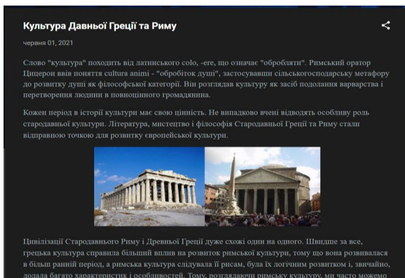
Додаток 1. Перший скріншот статті «Культура Давньої Греції та Риму»