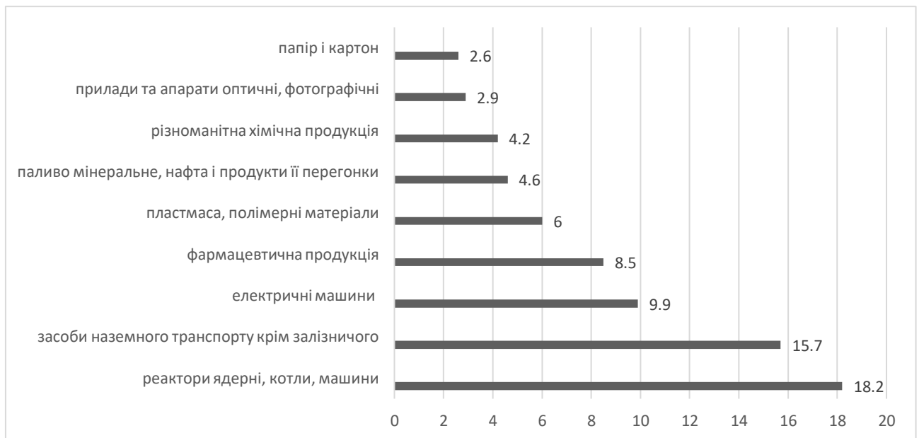
Рисунок 2.2 – Товарна структура імпорту з Німеччини до України

(5,3%); деревини і виробів з деревини (5,0%); чорних металів (4,2%); зернових культур (3,0%) [6].