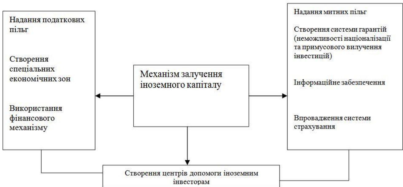
Рис. 2.3.1 Механізм залучення іноземного капіталу

Податкові та тарифні пільгові системи включають "податкові канікули", зниження податкових ставок у разі реінвестування або інвестування прибутку в певні регіони та галузі, запобігання подвійному оподаткуванню та звільнення від тарифів на нові імпортні машини та обладнання, технології, знання як і як експортувати себе. Виробляти продукцію для покриття валютних витрат або зменшення цих витрат. Спеціальні економічні зони забезпечують більш повну податкову та тарифну пільгову систему та спрощують адміністративні процедури (рис. 2.3.2).