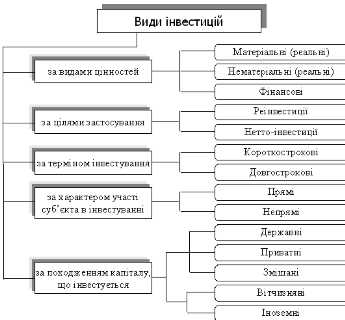
Рис.1 Класифікація інвестицій

Інколи виділяють інвестиції за регіональною ознакою. Інвестиції всередині країни (внутрішні) означають вкладення коштів в об'єкти інвестування, які розміщені в територіальних межах даної країни. Під інвестиціями за кордоном (зарубіжними) розуміють вкладення коштів в об'єкти інвестування, які розміщені за межами території даної країни. До таких інвестицій відносять придбання різноманітних фінансових інструментів інших країн – акцій закордонних компаній, облигацій інших держав тощо.