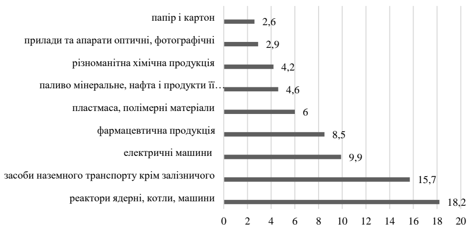
Рисунок 2 – Товарна структура імпорту з Німеччини до України [складено авторами на основі 2]

У структурі експорту українських товарів до Німеччини переважають поставки: електричних машин (17,4%); насіння і плодів олійних рослин (16,8%); одягу та додаткових речей до одягу (6,3%); руди, шлаки і зола (6,0%), меблів (5,8%); реакторів ядерних; котлів, машин (5,8%); виробів з чорних металів (5,3%); деревини і виробів з деревини (5,0%); чорних металів (4,2%); зернових культур (3,0%) [2].