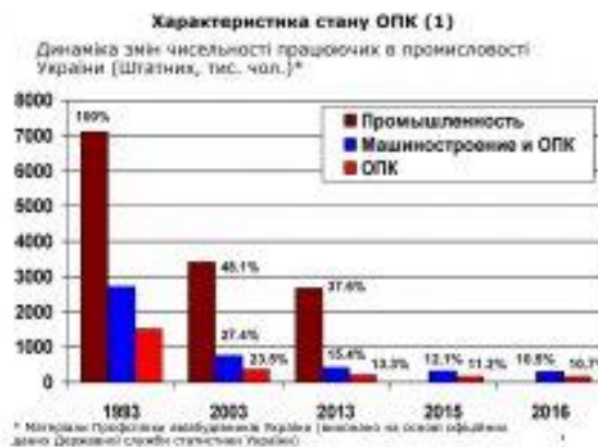
Рис. 1.1 Динаміка зміни чисельності працюючих в промисловості України.

Характеристика стану підприємств оборонно-промислового комплексу України наведена на рис. 1.1. – 1.3.