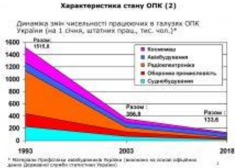
Рис. 1.2 Динаміка зміни чисельності працюючих в оборонно-промисловому комплексі України.