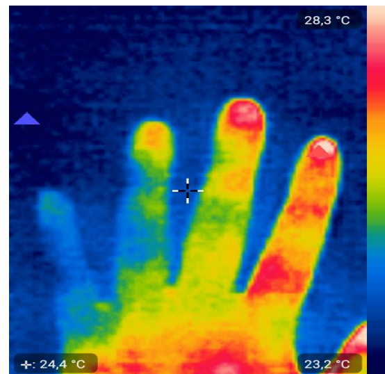
Рисунок 3 – Термограма кисті дитини з артеріальною гіпертензією через 15 хв. після холодової проби (пацієнт В., 15 років)

При чому у переважній більшості цих дітей максимальна температура тепловипромінювання на вказівному чи середньому пальці відновлювалась, в той же час на 4-му та 5-му пальцях вона залишалась знижена, що добре видно на рис 3. В інших 7 (33,3 %) дітей на 15 хв. спостерігалось повне відновлення термоемісії на тильній поверхні кисті.