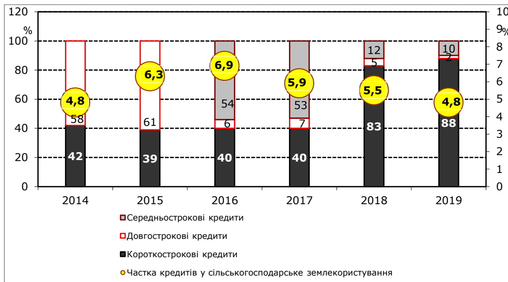
Рис. 2. Структура портфеля банківських кредитів у сільськогосподарському землекористуванні України (авторські оцінки)

Економічні фактори (E). В умовах стабільно низького рівня бюджетного кредитування АПК функції кредиторів у такому разі покладаються на комерційні банки. Дотепер інвестиції в АПК займають незначну частку у структурі кредитного портфеля комерційних банків (Рисунок 2), що є свідченням низької інвестиційної привабливості АПК для банківського капіталу.