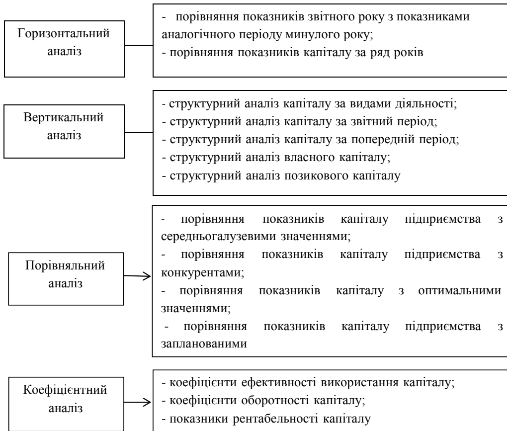
Рис. 2. Методи аналізу капіталу підприємства [4, с. 146]