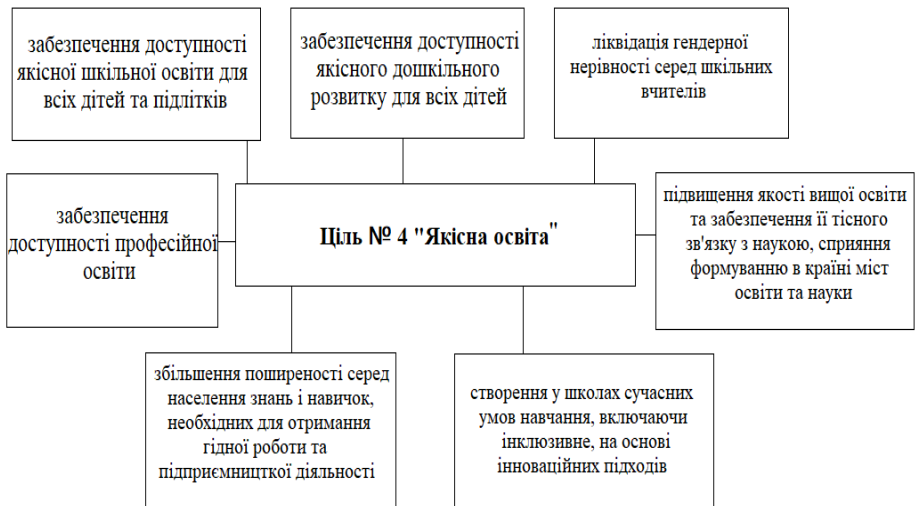
Рис. 1. Головні завдання цілі сталого розвитку № 4 «Якісна освіта» Складено автором за [6]

Так, якщо більш детально розглянути означену ціль сталого розвитку, то можна виокремити більш детально її основні завдання [1 – 4]: