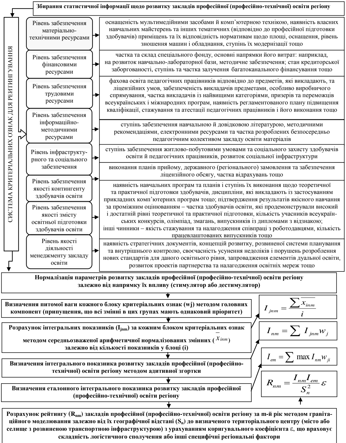
Рисунок 5 – Методичні засади рейтингування закладів професійної (професійно-технічної) освіти при оптимізації їх регіональної мережі