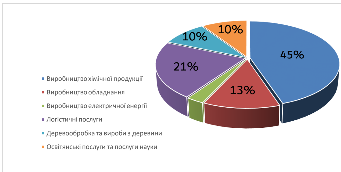
Рис 3.1 Структура продукції, що виробляється на підприємствах індустріального парку "Свема"

Цікаву історію має створений та один з небагатьох діючих в Україні індустріальний парк “Свема”, метою якого є залучення інвестицій в економіку громади та наукового потенціалу для виробництва інноваційної продукції, підвищення рівня соціальних стандартів. На території парку у фармацевтичній, хімічній, деревообробній та інших галузях працюють 32 підприємства-супутників. На території парку є стимули для резидентів, а саме: звільнення від митних платежів; надання в оренду землі за добу на пільгових умовах; створення житлової та комунальної інфраструктури для працівників. Більшість продукції виробляється підприємствами хімічної індустрії, решту продукції та послуг ми можемо побачити на діаграмі.(див. рис. 3.1)