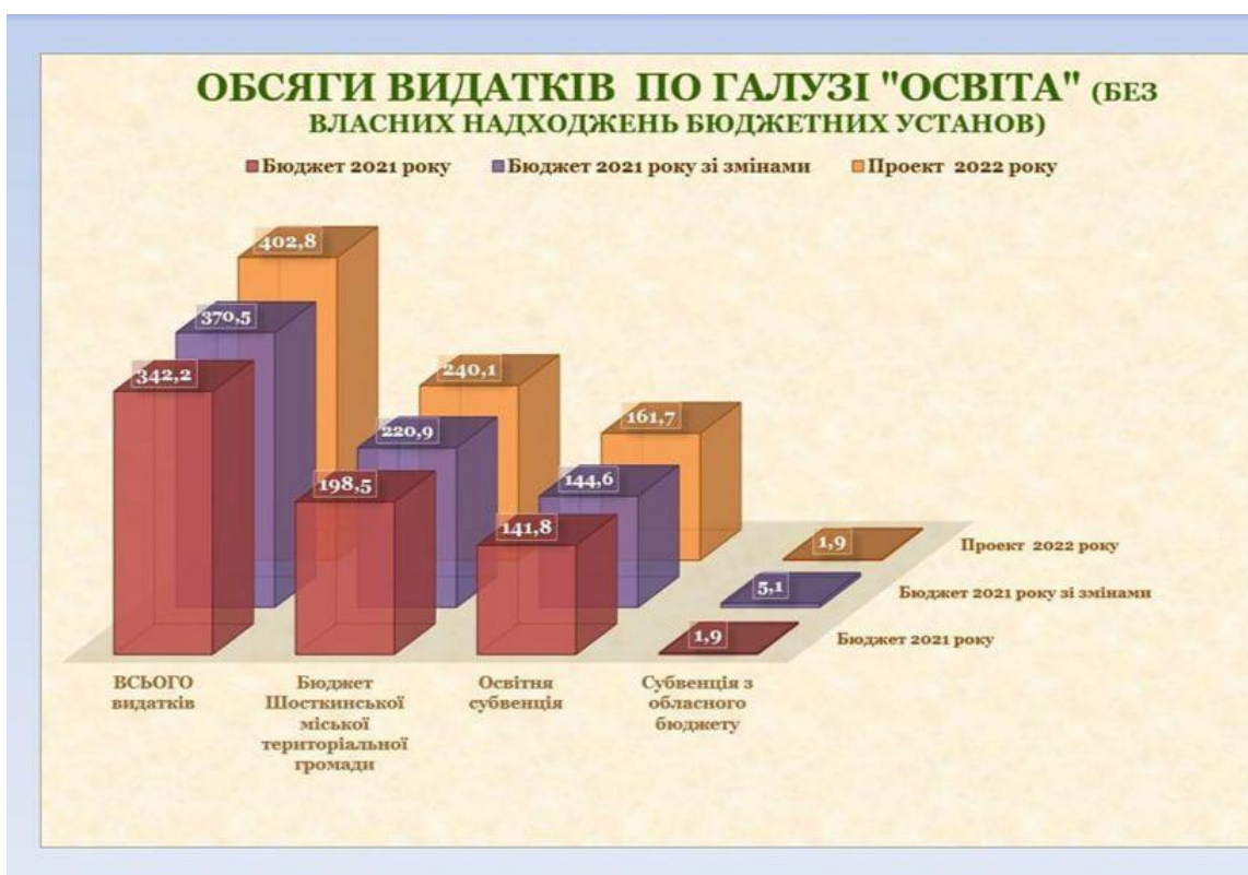
Рис 2.3 Обсяги видатків по галузі "Освіта", тис.грн

Необхідно удосконалювати середню освіту в громадах. Перш за все збільшувати фінансовий ресурс на матеріальну базу шкіл. Структура шкіл повинна відповідати Європейським стандартам. В Європі на одного вчителя 15-17 учнів, в Україні 8-9. В нашій громаді -7.