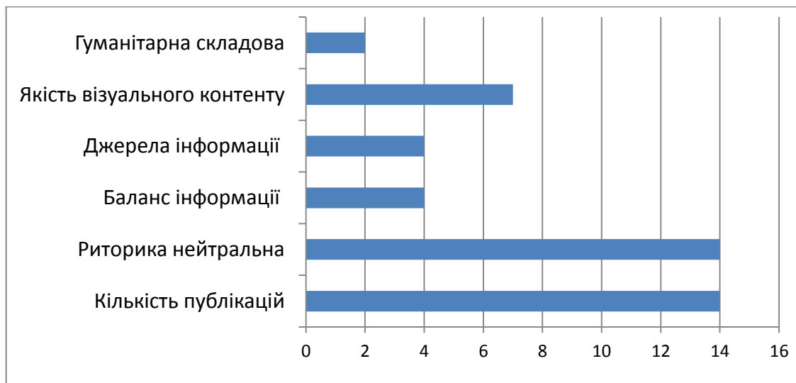
Рис. 6 – Дотримання журналістських стандартів у поданні новин про збройний конфлікт у Нагірному Карабасі на сайті «DW.com»

З 27 вересня по 1 вересня по 10 листопада 2020 року на сайті « DW.com » загальна кількість матеріалів із згадкою про топонім «Нагірний Карабах» – 53 публікації. Із них новинних матеріалів – 14. Результати контент-аналізу новинних матеріалів узагальнено ілюструє діаграма на рис. 6.