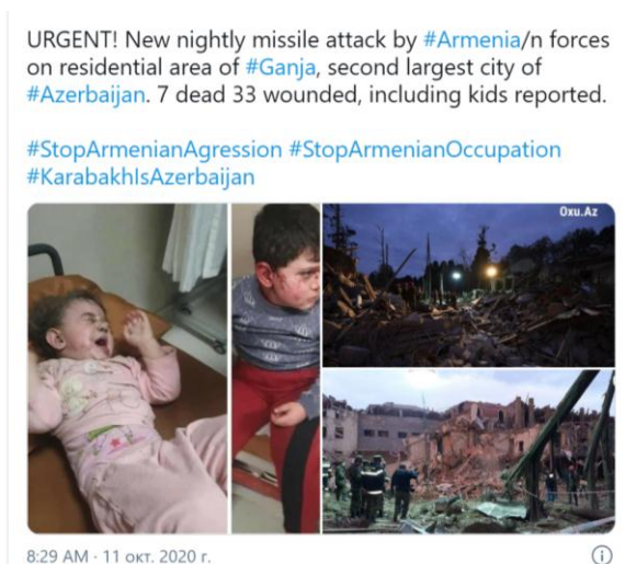
Рис. 5

Щодо гуманітарних аспектів, то вони висвітлюються в 58% інформації. У матеріалі «Нагірний Карабах: сторони заявили про загибель мирних жителів» (УП, 27.09.2020) з боку Азербайджану подаються точні дані із зазначенням імен жертв мирних жителів, ці факти можна перевірити; з боку Нагірного Карабаху – лише статистика. Представлено обидві сторони конфлікту. Далі подаються втрати військових та військової техніки з обох боків, але за словами представників Нагірного Карабаху, що також є порушенням стандарту балансу інформації, тобто висвітлюється факт однобоко. «У результаті обстрілу Гянджі в Азербайджані загинули 7 осіб, десятки поранені» (11.10.2020) – додається фото потерпілих під час обстрілу дітей без супроводу дорослих. Це є порушення журналістських стандартів. Хоча якщо врахувати, що фото взято з офіційного каналу МЗС Азербайджану, то, можливо, і був дозвіл від обох батьків (що сумнівно), див. рис. 5.