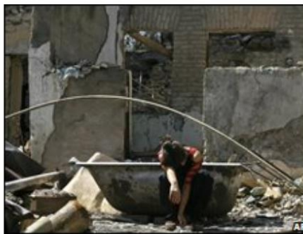
Many grieving Ossetians say they hope the Georgians never come back

Фотографії. Журналісти BBC у своїх матеріалах, присвячених бойовим діям, описують не криваві сцени, а спустошені осетинські та грузинські села, фотографії яких справляють на читача велике враження, дають уявлення про відчуття страху через те, що відбувається (втрата будинку, рідних, рідної землі), виглядають не менш «важкими» для морального сприйняття, але при цьому відповідають стандартам висвітлення конфліктів BBC. На фотографії нижче ми бачимо жахливу картину: дівчина перебуває в тому, що нещодавно було ванною кімнатою її тепер уже зруйнованого будинку і найжахливіше те, що ми не знаємо, чи вона жива, або обстріл застав її зненацька і надії більше немає. Незважаючи на те, що на фото немає крові, гнітюче та тривожне почуття напруги не залишає читача до останнього рядка, залишаючи його спроби з'ясувати долю дівчини на фото марними.