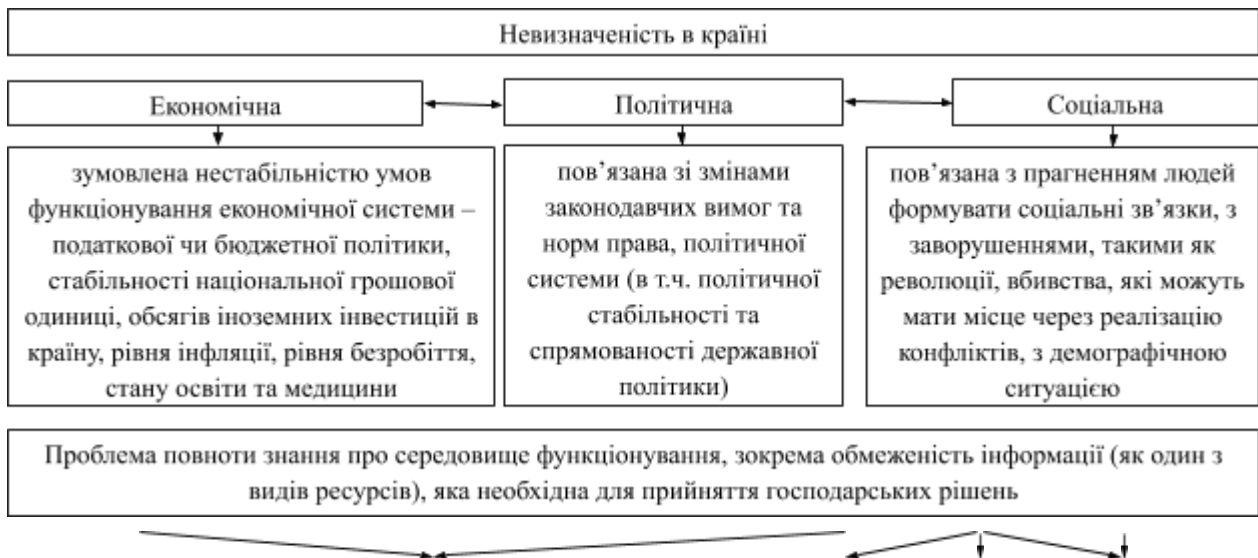
Рис. 2. Взаємозв'язок економічної, політичної та соціальної невизначеності

Поняття невизначеності є досить складним і має прояв в усіх сферах, звідки і з'являються її ключові класифікаційні ознаки (рис. 2).