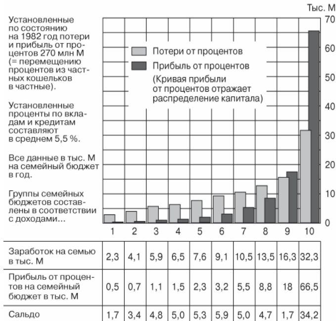
Рис. 3. Сопоставление доли населения, терпящего потери от кредитной системы, и доли граждан, оказывающихся в выигрыше

Имея в своем распоряжении такую пирамиду, можно безбоязненно разрешить демократию и свободы абсолютно во всем, кроме посягательства на саму пирамиду, точнее «стрелу луковицы». Ну а посягать на нее даже в мыслях очень сложно: массовое сознание поддерживается с помощью СМИ в состоянии поглощенности суетными, сенсационными, катастрофическими, трагическими социальными проявлениями и мифическими представлениями («демократия», «свобода», «необходимость конкуренции», «терроризм»).