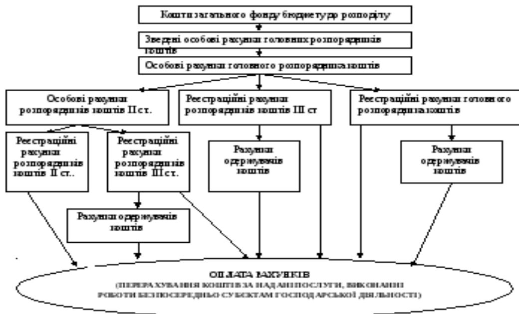
Рисунок 1.2- Схема касового обслуговування коштів державного бюджету загального фонду за видатками

Схематично здійснення видатків при казначейському обслуговуванні загального фонду державного бюджету зобразимо на рисунку 1.2.