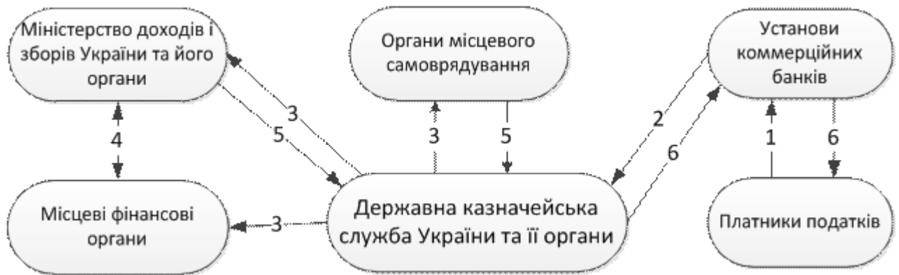
Рисунок 1.1- Процес казначейського обслуговування державного бюджету за доходами

Основні етапи процесу казначейського обслуговування державного бюджету за доходами є наступні: