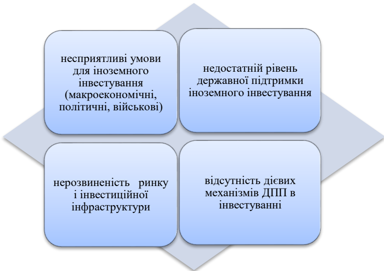
Рисунок 2 - Головні проблеми залучення іноземного інвестування до України

Таким чином, аналіз основних проблем інвестиційної привабливості економіки України, особливо з урахуванням реалій воєнного часу в країні, вказує на потребу перегляду основних векторів монетарної та фіскальної політики для забезпечення стратегічного полегшення доступу іноземного інвестора до прямого та портфельного інвестування в Україні, особливо на фоні нерозвиненого фондового ринку, військових втрат та загроз, недосконалої нормативної бази з високими монетарними обмеженнями стосовно вільного руху капіталу та фінансового моніторингу, спрощення умов оподаткування виведеного капіталу.