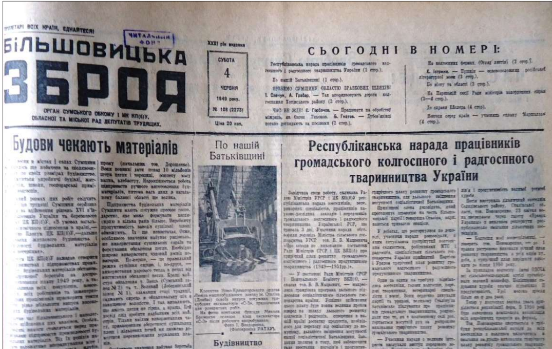
Фото 2. Передовиця газети «Більшовицька зброя» за 4 червня 1949 р. зі статтею, присвяченою проблемі виробництва будматеріалів на Сумщині

У 1948 р. підрозділи «Укрпромсільбуду» отримували лише 58 % від необхідної кількості цегли, 53 % – металовиробів, 51 % – в'язучих матеріалів, 36 % – покрівельних матеріалів і 33 % – лісоматеріалів [13, арк. 5]. Приблизно в той же час рівень забезпеченості «Цивільбуду» цеглою складав 23 %, а в'язучих матеріалів – взагалі 10 % від встановленої потреби [10, арк. 15].