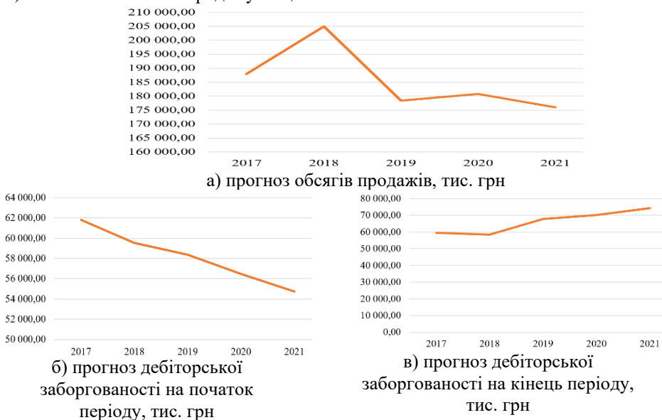
Рисунок 1. Прогноз обсягу продажу, дебіторської заборгованості на початок та кінець на 2020–2021 рр.

від інвесторів чи інших зацікавлених осіб, що не входять в коло контрагентів; б) збільшення обсягів продажу тощо.