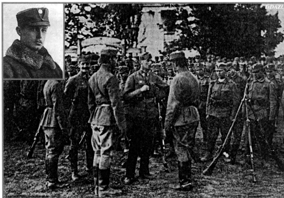
Вільгельм Габсбург в колі Українських Січових Стрільців. Олександрівськ, травень 1918 р.

Джерело доступу: https://uain.press/blogs/vasil-vishivaniy-avstrijskij-ertsgertsog-u-borotbi-za-ukrayinu-1170901