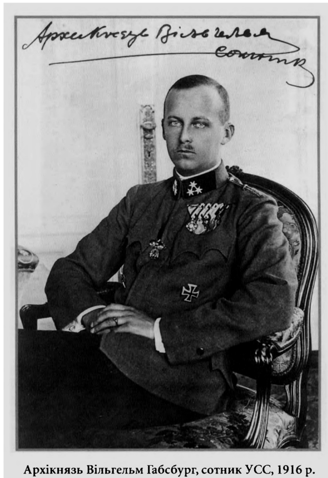
Архікнязь Вільгельм Габсбург, сотник УСС, 1916 р.